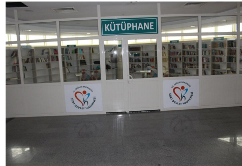
Şekil 1. Türkiye’de hastane kütüphaneleri