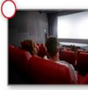
Şekil 4. “Wie Bitte? ders kitabı s.44

Zamanları anlama kazanımına yönelik kitapta etkinlik sayısı oldukça sınırlı sayıda yer almaktadır. Burada öğrencinin zaman ifadelerini dinlemesi ve resimlerle eşleştirilmesi istenmektedir.