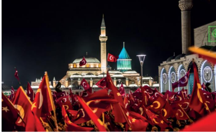
Şekil 1. Demokrasi nöbetleri (s. 212).

Bu doğrultuda devletin bekasına karşı tehditler kategorisi altında dile getirilen diğer kodlar; “Darbe girişimleri ve zararları” (n:2), “Dünyada darbe örnekleri” (n:1) ve “Ülkemizde daha önce gerçekleşen darbeler” (n:1) kodları sırasıyla ifade edilmiştir.