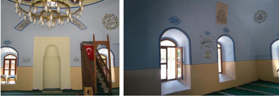
Fotoğraf 12-13: Boduroğlu Camii. Harimin Güney ve Doğu Duvarları (2021).

Harimin güneybatı köşesinde yer alan ahşap minberin yan aynalığında eşkenar dörtgenlerden meydana gelen geometrik süsleme, dolap yan aynalığında ise ajur tekniğinde bitkisel süslemelere yer verilmiştir. Köşk kısmının külahı yoktur. Cam göbeği renginde yağlı boya ile boyanmış olan minberin üzerindeki boyalar son restorasyonda temizlenmiştir.