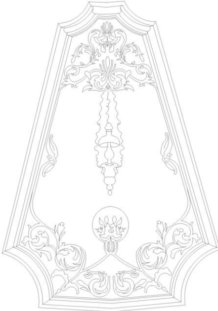
Çizim 3: Kubbedeki Kartuşlardan Detay.