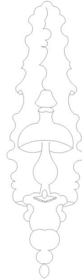
Çizim 4: Kubbedeki Asma Kandillerden Detay.