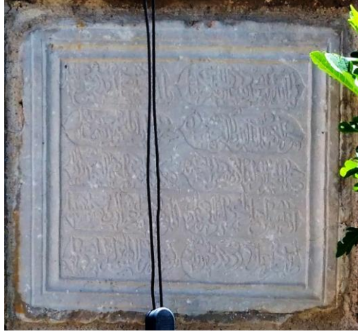
Fotoğraf 1: Boduroğlu Camii. Minaredeki Kitabe (2021). 28