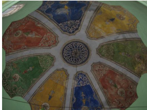
Fotoğraf 10-11: Boduroğlu Camii. Restorasyon Öncesi Minberi ve Kubbesi (2014).