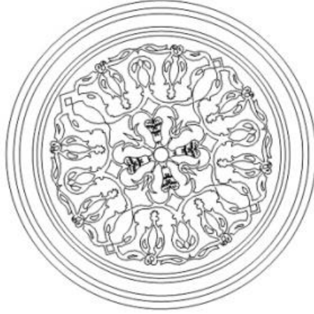
Çizim 2: Kubbe Göbeğinde Yer Alan Bezeme.

Yukarıda da belirtildiği üzere, kubbe eteğinde, harim duvarlarında yer alan Allah, Muhammed, dört halife isimleri ve dini içerikli yazılar, pencere çevrelerindeki fletolar en son restorasyondandır.