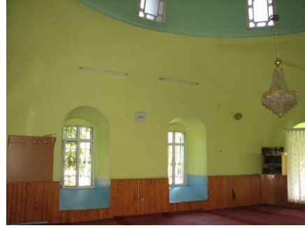
Fotoğraf 8-9: Boduroğlu Camii. Restorasyon Öncesi Harimin Güney ve Doğu Duvarları (2014).