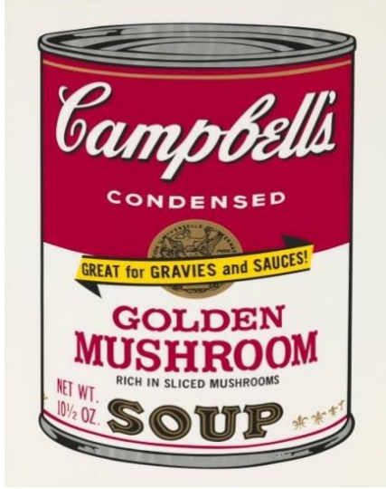
Resim 6: Andy Warhol, 32 Campbell's Soup Cans, 1962, (URL-8)

Battaglini tarafından parodi yolu ile üretilen bu eser, baş melek Michael' in kutsallığını bir popüler kültür imgesi ile yorumlanmaktadır. Postmodern sürecin bir ifadesi olan, gücü ve kurtarıcı rolünü üstlenen sinema karakterini bir yansılama yaparak yeniden resmetmiştir. Arka planda yer alan grafitiler, günümüz duvar resimlerine gönderme yaparak resmedilmiştir. İzleyicinin ilk bakışta fark edemediği dövmeler Michael'in kudretini vurgulamaktadır.