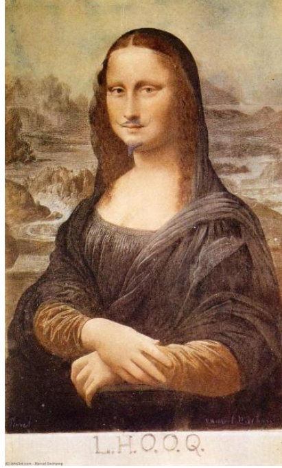
Resim 3: Marchel Duchamp, LHOOQ, (URL-5)

kültürünü de parodi yolu ile uygulayarak görsel bir ifade yolu olmuştur. Caps ifadesi 'Capture' yani yakalamak kelimesinden türetilmiştir (Url-1). Caps'in kolajlama, alıntılama ve parodi gibi kavramlarla beslenerek yeniden ürettiği görseller, günümüzün tüketim kültüründe bir popüler kültür imgesi haline gelmektedir. Postmodernist süreçte parodiden etkilenen alanların başında; resim, grafik, heykel, sinema imajları, müzik, mimari vb. gibi alanlar yer almaktadır. Sanat eserinin yüceliğini indirgeyerek geçmişe öykünen sanatçı, yeniden ürettiği sanat eserlerinin kopyalanabilir mallar kategorisine kaymasını etkin kıldı (URL-2).