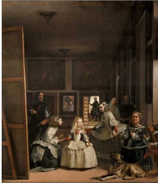
Resim 1: Velazquez, Nedimeler (Las Meninas), 1656 (URL-3)

Bir diğer alıntılama yöntemini eserlerinde kullanan ünlü sanatçı Pablo Picasso’ dur. Kendine has tarzıyla Velazquez’in “Nedimeler”, Francisco Goya’nın “3 Mayıs 1808”, Nicolas Poussin’in “Pan’ın Zaferi”, Eugene Delacroix’nin “Cezayirli Kadınlar”, Manet’nin “Kırda Öğle Yemeği” adlı eserleri ve buna benzer birçok eserden etkilenerek yeniden resmetmiştir. Picasso’nun eserleri, Avrupa sanat tarihinin özeti gibidir diyebiliriz. John Berger, Picasso’nun üzerine çalışacağı kendine ait bir şey olmadığını ve başka ressamın tablolarındaki temaları ele aldığını belirtmektedir. Velazquez’in “Nedimeler” adlı eserini yeniden resmettiği “Velazquez’den Sonra Nedimeler” adlı eserinde Picasso, sanatçıyı onurlandırır (Berger, 2015: 195-200).