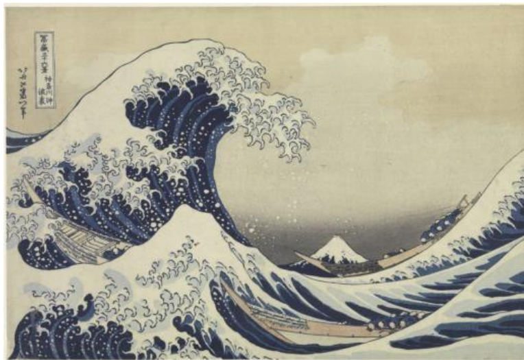
Resim 9: Katsushika Hokusai, The Great Wave of Kanagawa , 1829-1832 (URL-11)