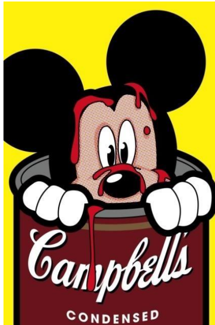
Resim 7: Greg Guillemain, Mickey Mouse and Andy Warhol, 2011 (URL-9)

“Campbell çorba tenekelerini” serigrafik baskı tekniği kullanarak yeniden üreten sanatçı, ürünün sıradan olan, çokça tüketilen, kolayca bulunan ve herkes tarafından bilinen, günlük tüketim nesnesinden çıkarıp bir postmodern sanat anlayışı ile bir sanat eserine dönüştürmüştür. Sanat hayatının büyük bir bölümünü popüler kültürden esinlenerek eserler üreten sanatçı, tüketim kültürünün sanat ile iç içe geçmesine katkı sağlamıştır (Moma: 2019).