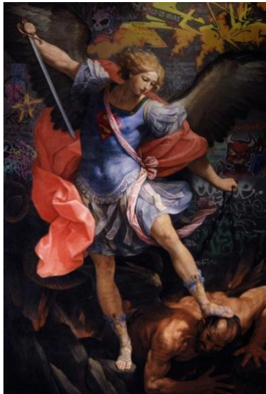
Resim 5: Marco Battaglini, Concussus Surgo , 2015 (URL-7)

Reni'nin eseri incelendiğinde göze ilk çarpan, korkunç ve şiddetli bir mücadelenin sonuna gelmiş iki figür görülmektedir. Ölümcül darbe öncesi zafer duruşu sergileyen Michael, büyük mücadele sonunda kazandığını ilan eder gibi resmedilmiştir. İyilik ve kötülük, karanlık ve ışık arasındaki bir savaşın sonunu getiren Michael ve düşmüş olan bir ruh sembolize edilmiştir. Baş melek Mikail tarafından boyun eğdirilerek, ayağı ile kafasına bastırılmıştır. Michael'in ayağının kenarına yansıtılan ışık, şeytanın yüzündeki mağlubiyeti direk ezici bir güçle göstermektedir. Michael'ı süsleyen kıyafet, bir Romalı asker tarzında resmedilmiştir. Askerlerin itibarının ne kadar yüce olduğu da bu karede gösterilmektedir (Wikiart: 2019). Kılıcı, tereddüt ve tehdit olarak algılanıyor, belki de kötü yaratığın nasıl yenileceğine dair seçeneklerini tartmaktadır. Yaşamak mı yoksa ölmek mi? Arka plan, iki figür arasındaki savaş kadar karışık, dönen bulutlar ve alevler savaşın ne kadar zorlu geçtiğinin bir yansıması olabilir. Bu etkili ve güçlü çalışmayı yaratan sanatçı Guido Reni, doğaya ait nesnelere resmetme konusunda uzmanlaşmıştır.