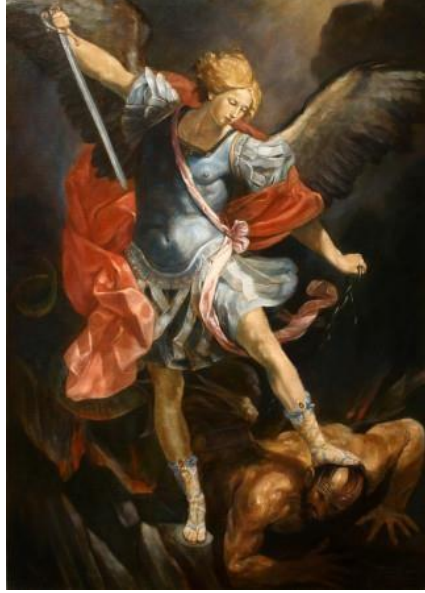
Resim 4: Guido Reni, Archangel Michael , 1635 (URL-6)

Parodi, sanat tarihine mal olan eserlerin hem etkileyici kısımlarını alır hem de yaratıcılığı aşılacaktır. başyapıtı mizahi eklemeler yaparak veya başka bir eserle birleştirilerek üretilen eserler özellikle Postmodernist süreçte teknolojinin gelişmesi ve hızla ilerlemesi, dünya nüfusunun büyük bir çoğunluğunun teknolojik materyallere olan ilgisini arttırmaktadır. Bu ilgi artışı kişilerin geleneklere bakış açısını değiştirmiş, tabularını yıkararak ulaşılamayan nesnelere ulaşılabilir kılmıştır.