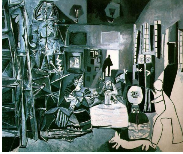
Resim 2: Pablo Picasso, Velazquez'den Sonra Nedimler , 1957 (URL-4)

resmettiği, her seferinde biçimler üzerine farklı denemeler yaptığı bilinmektedir. Berger'e göre; Picasso için bunlar iki amaca hizmet etmektedir: Birincisi, ustaların yaptıklarını Picasso'nun da yapabileceğini kanıtlamak, ikincisi de kültürel geleneklere verilen değerlerin ve onur payesinin abartılı olabileceğini göstermek (Berger, 2015: 111-2).