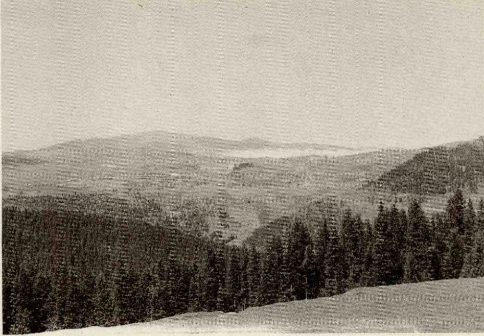
Fotograf 4- Yerlice yaylasından bir görünüm. Photo 4- A view from high plateau houses.