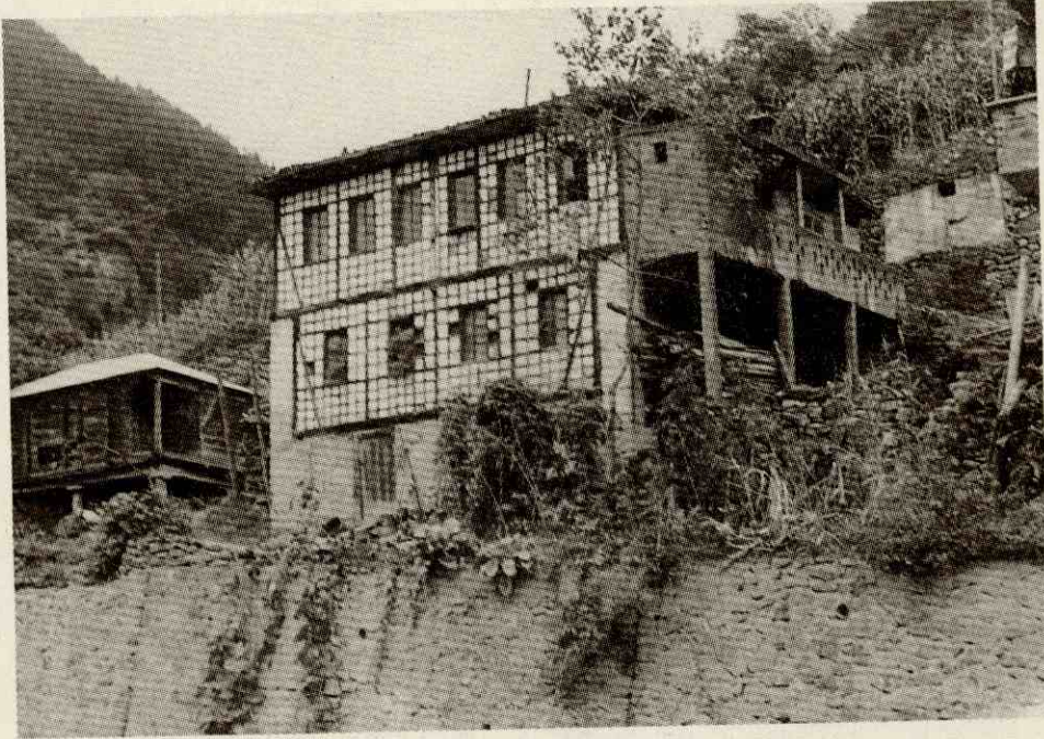
Fotoğraf 1- Başarköy evlerinden bir görünüm. Photo 1- A view from the village houses in Başarköy.

Değirmendere havzası, Doğu Karadeniz Coğrafi Bölümü'nden seçilen, bölgenin hemen bütün coğrafi özelliklerinin karakteristiklerini taşıyan, dolayısıyla önemli fiziki ve beşeri sorunları da olan bir alandır. Bu problemlerin varlığı bir kader değildir. Yöre insanı kendine bahşedilen pratik zekasını kullanıp, zaten pek çok olumsuzlu olumluya çevirebilmeyi başarmıştır. Bölgenin bugüne kadar değerlendirilemeyen birçok avantajlarından başlıcaları zengin tarihi ve doğal varlıklarıdır. Potansiyeli ekonomik değer olarak bölgeye kazandırırken, yöre insanını mutlak surette faaliyetlerin içerisinde düşünmek gerekir. Çünkü, turizmin önemli özelliklerinden birisi de yörenin geleneksel hayat tarzını başka insanlara tanıtmaktır. Bunun için en uygun yol, mezraa ve yaylalarda hatta köylerde pansiyonculuğu teşvik etmektir. Aksi halde sadece birkaç yıldızlı otelin rastgele hayata geçirilmesi, sağlanan ekonomik girdinin yöre insanına rasyonel dağıtılamaması sorununu ortaya çıkarabilir. Şu halde, sahada alt yapı ile destekli turizm çalışmalarının yanı sıra, kredi destekli pansiyonculuğun da yaygınlaştırılması akılcıdır. Zaten daimi iskan merkezlerinde göçler, geçici yerleşmelerde de hayvancılık fonksiyonunun zayıflaması nedeniyle pek çok mesken boştur. Bu da alt yapı bakımından önemli bir avantaj olarak düşünülebilir.