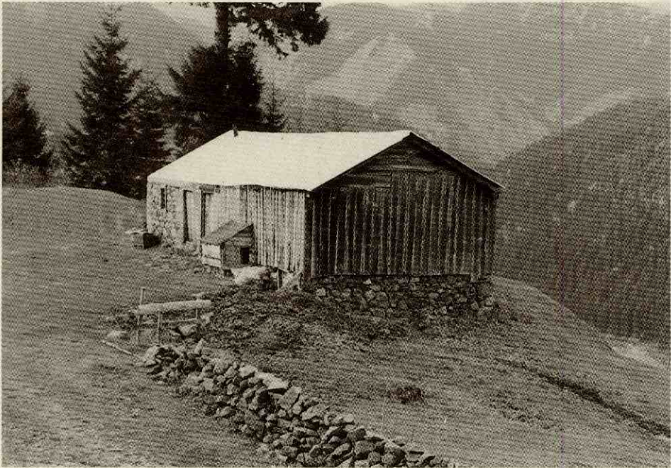
Fotoğraf 7- Bir mezraa evi görünümü. Photo 7- A view of a house in the meadow.