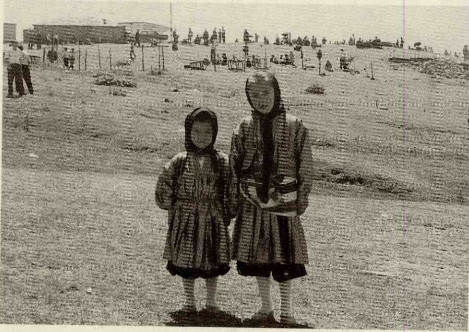
Fotograf 3- Geleneksel "Dernek"lerden bir görünüm. Photo 3- A view of traditional "Dernek" gatherings.