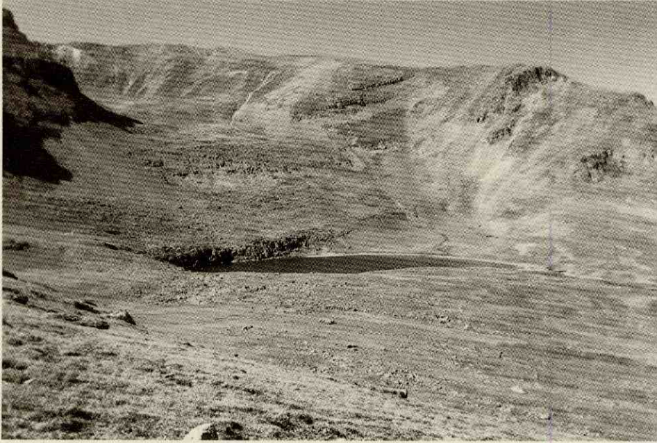
Fotoğraf 6- Çakırgöl'den bir görünüm. Photo 6- A view from Çakırgöl.