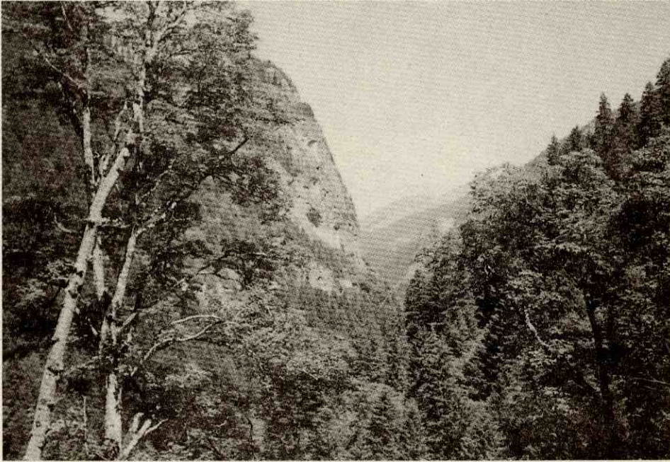
Fotograf 5- Meryemana Manastırı'ndan bir görünüm Photo 5- A view of Sumela Monastery.