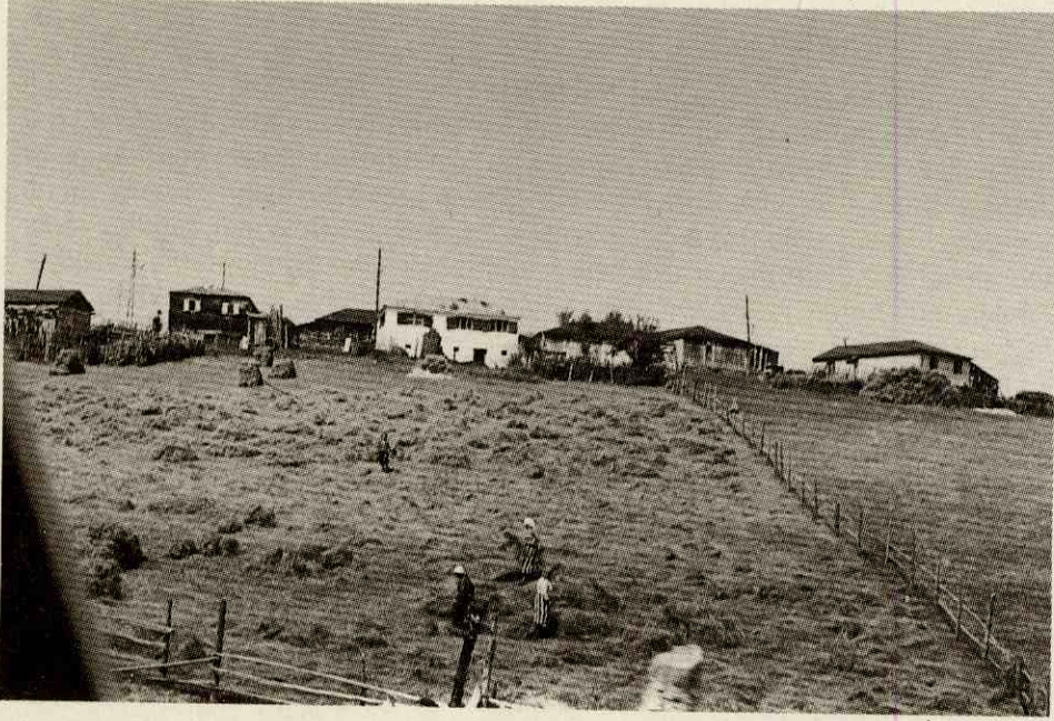
Fotograf 2- Yayla meskenlerinden bir görünüm. Photo 2- A view from high plateau houses.