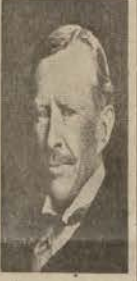
İngiltere'nin Başbakanı B. Çorçil

İngiliz Bayraklı buradaki tehlikeye bazı milletlerin dikkatini celbetti İngiliz milletini ita'at tebliğatı karşısında avranlığa davet etti Londra, 20. Ocak - B. Çorçil'in... Klisur'dun şimolinde Elen kıtaları ilerliyorlar