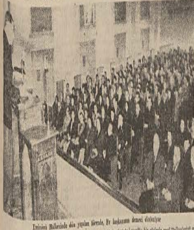
Tebliğ Halkevinde dün yapılan törende, Bk başkanımız demeci dinlettiye

Başbakan Şükrü Saracoğlu dün çok önemli bir demecde bulundu