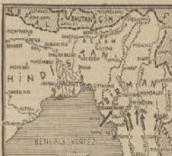
İktisad Vekilinin Mecliste yaptıkları izahat