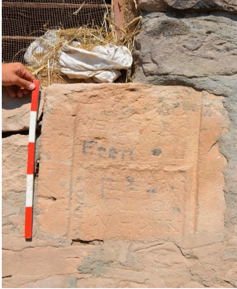
Görsel 13: Diler Köyü Yazıtları (Kaymakçı Arşivi)