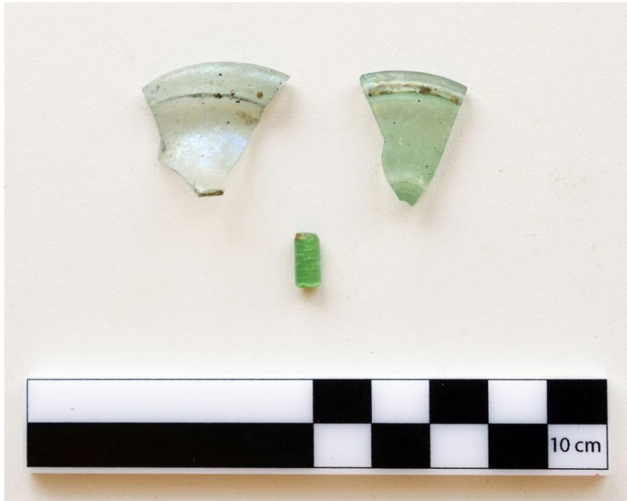
Görsel 12: Sarıtaş Yerleşimi Roma Dönemi Seramik Örnekleri (Kaymakçı Arşivi)