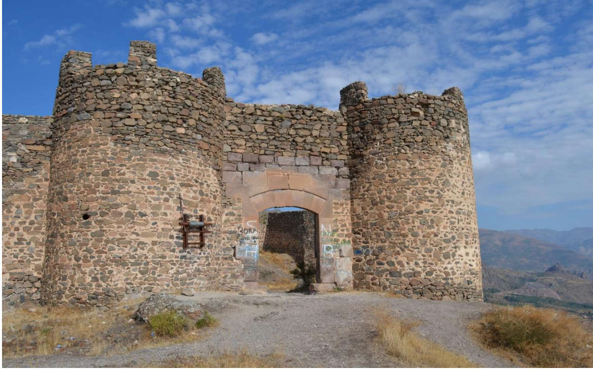
Görsel 5: Şebinkarahisar Kalesi