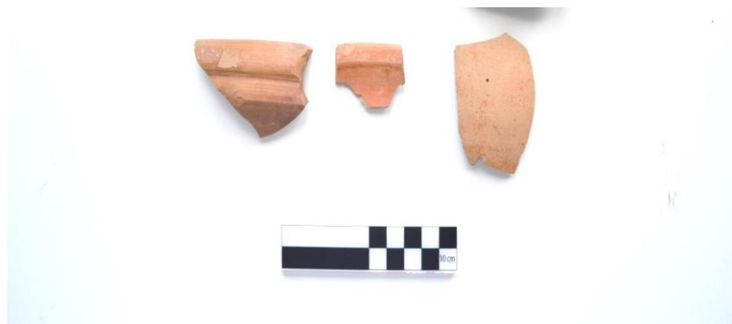
Görsel 14: Almoğun Mevkii de Hellenistik Döneme ait seramikler