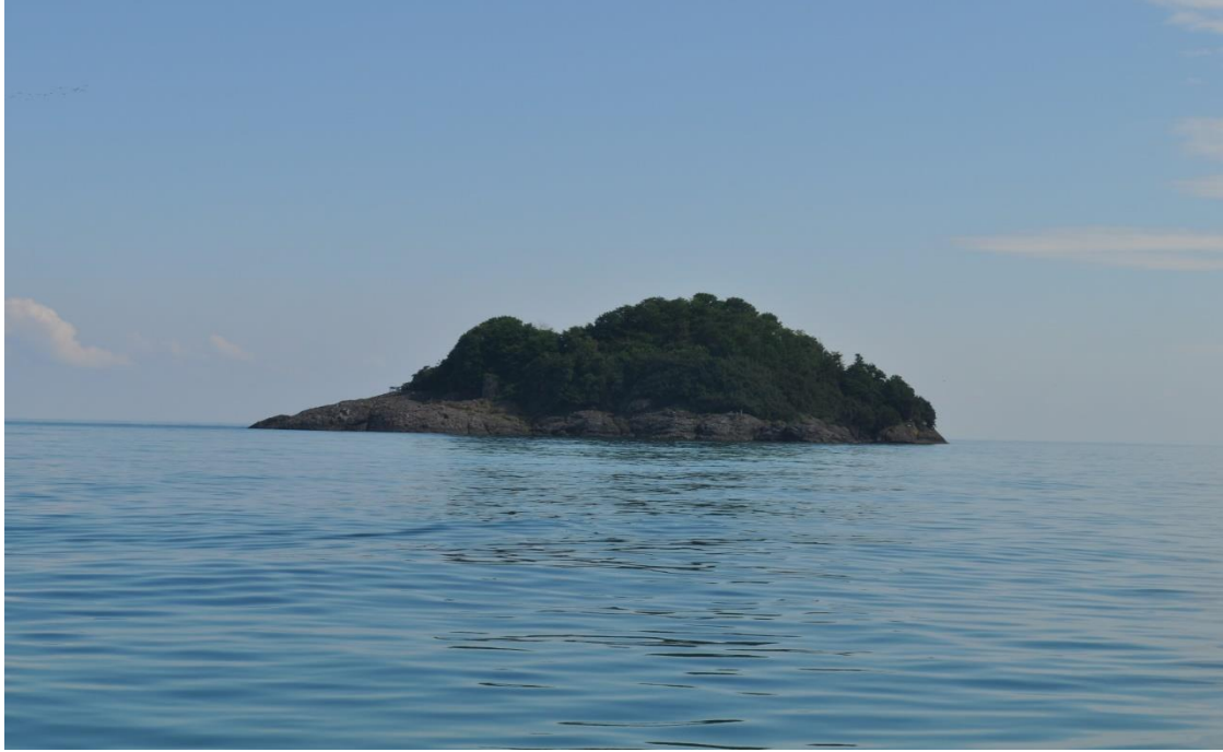
Görsel 1: Giresun Adası