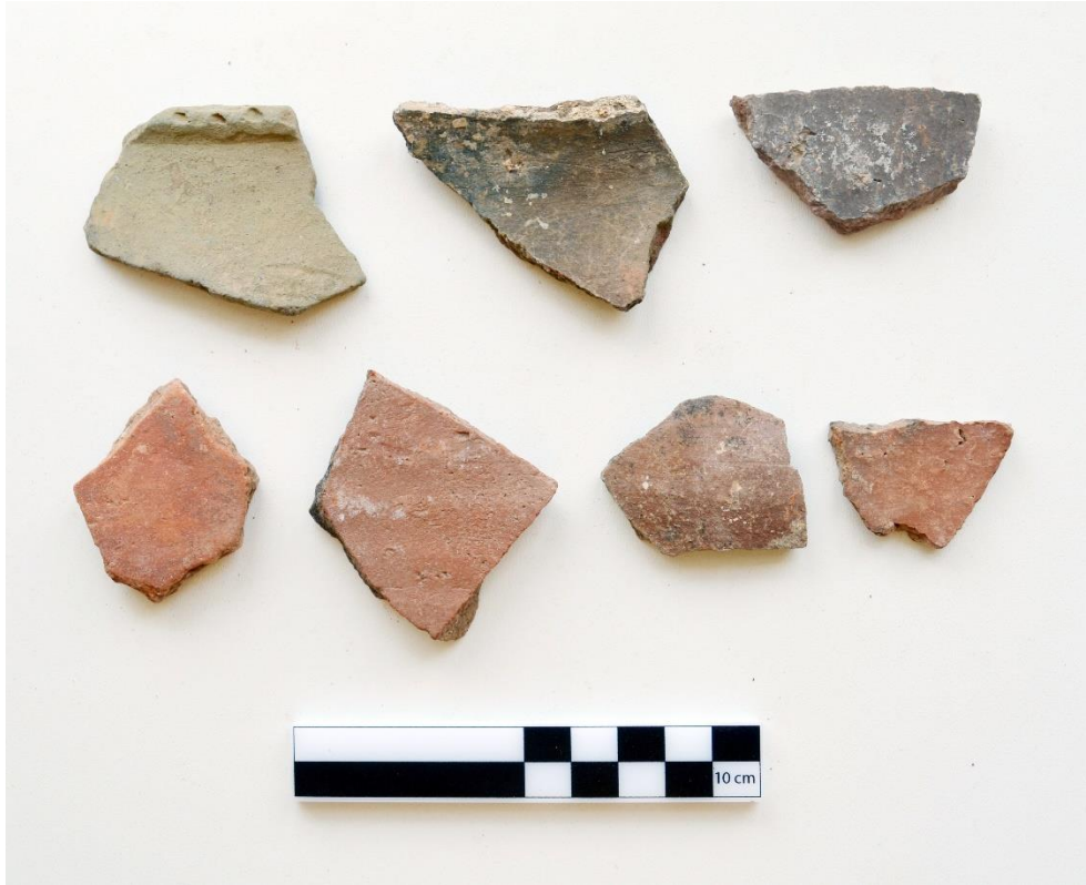
Görsel 9: Asarntaş Yerleşimi Hellenistik Döneme ait Seramikler (Kaymakçı Arşivi)