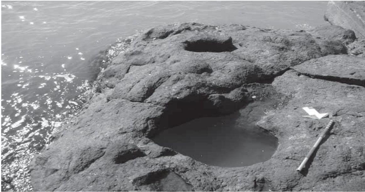
Görsel 4: Plamar bağlama Kalkası ve Halat toplama çukurları (Doksanaltı Ertekin M, Aslan Erdoğan, Mimirolu İ. Mete, 2010, “Giresun İli ve Giresun Adası Arkeolojik Yüzey Araştırmaları 2009”, Araştırma Sonuçları Toplantısı 2010, İstanbul Kültür Varlıkları ve Müzeler Genel Müdürlüğü, s. 143-162, s.160)