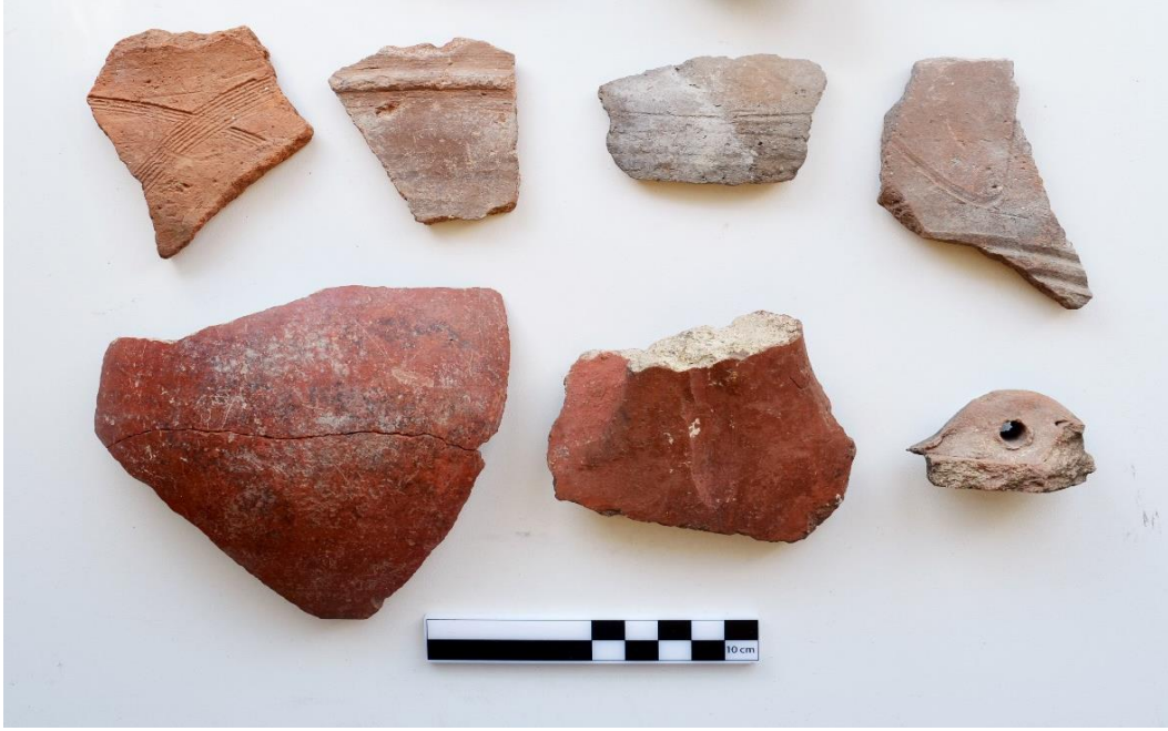
Görsel 7: Kaledere Kalesi yerleşiminde bulunan seramikler