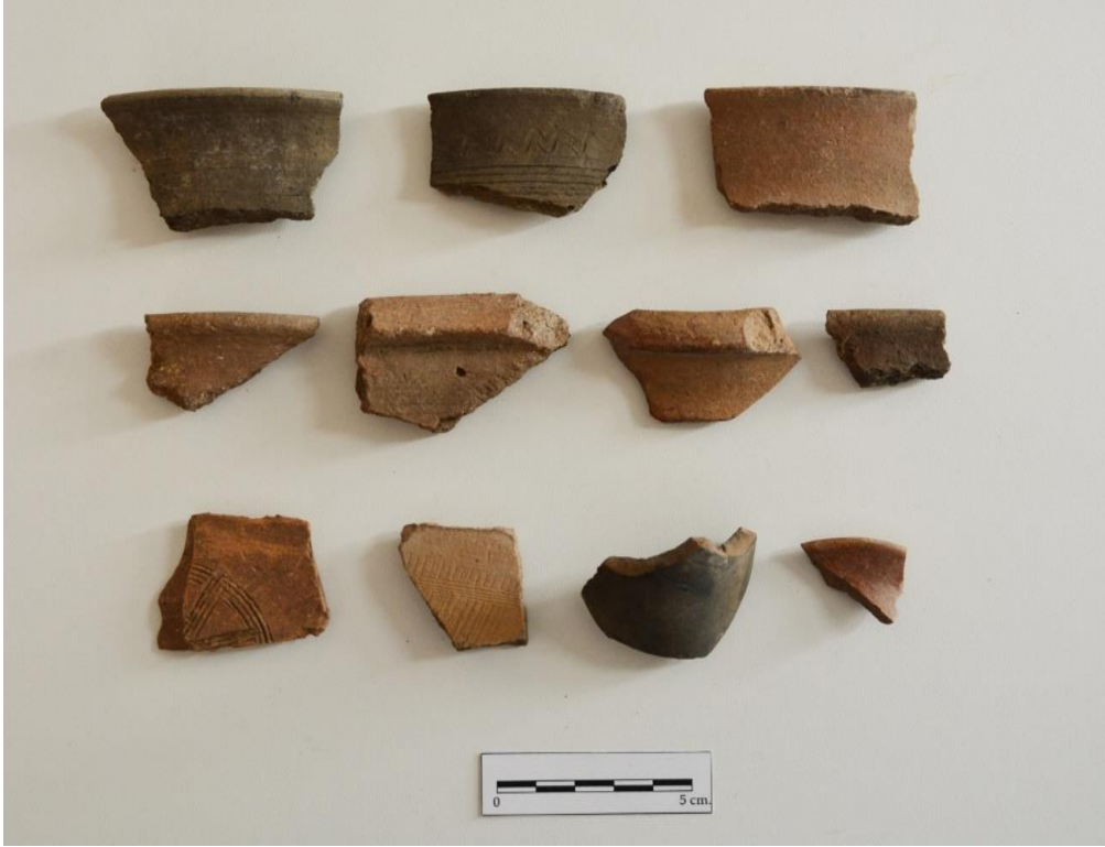
Görsel 15: Han Tepesi Höyük Seramik Örnekleri