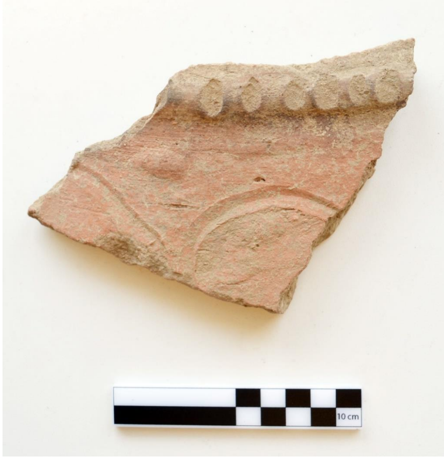
Görsel 11: Sarıtaş Yerleşimi Roma Dönemi Seramik Örnekleri