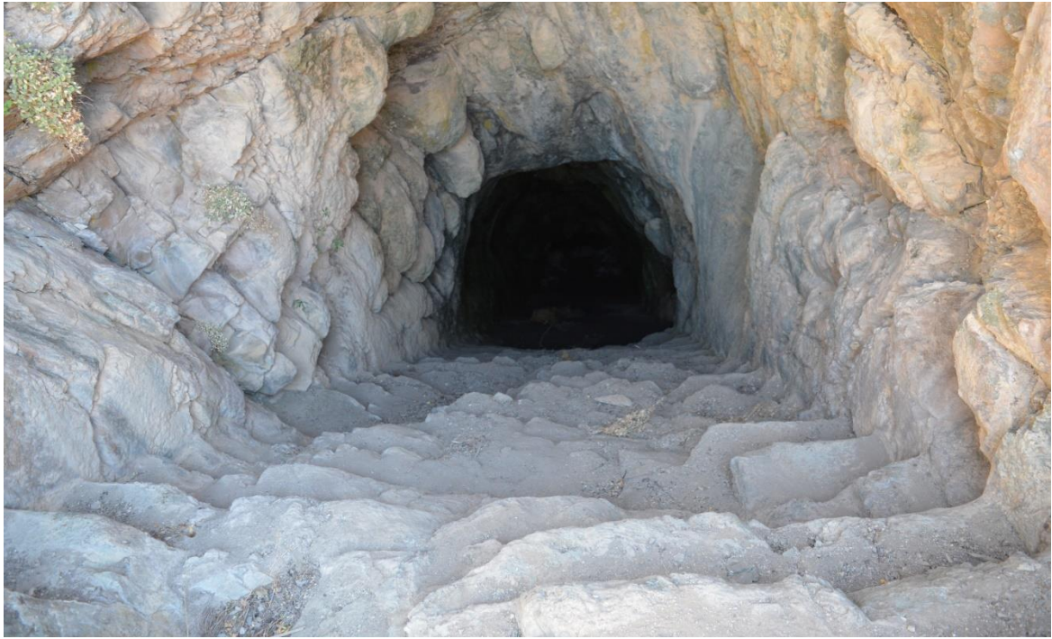
Görsel 6: Kaledere Kalesi Basamaklı Tünel girişi