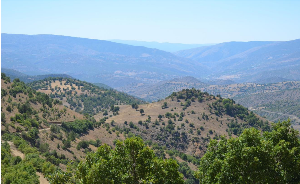
Görsel 8: Karadikmen Kale yerleşimi