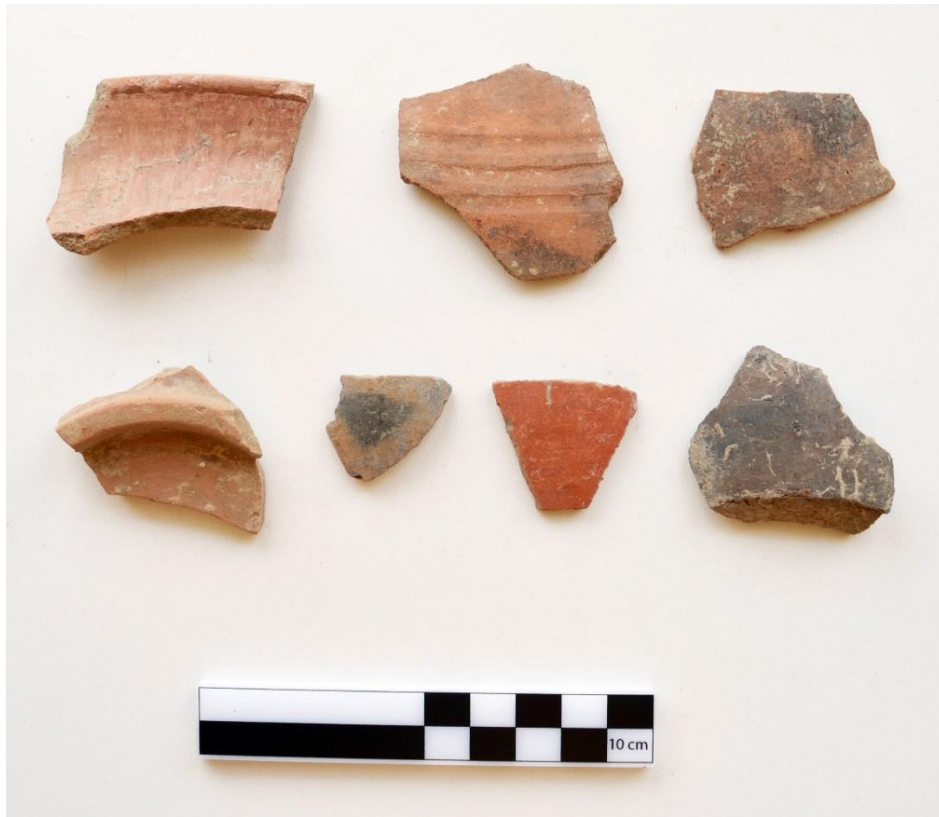
Görsel 10: Sarıtaş Yerleşimi seramik