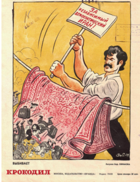
İkinci Karikatür 4

Not. Deviriyor ve İran İslam Devrimi Süreci. Efimova tarafından “Crocodile”de basılmıştır. Efimova, 1979, Crocodile , (10), s. 16. Telif hakkı [1979] Pravda Yayınevi.