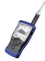
NTI Oda Analizörü