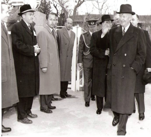
ABD Başkanı Eisenhower'ın Karşılması