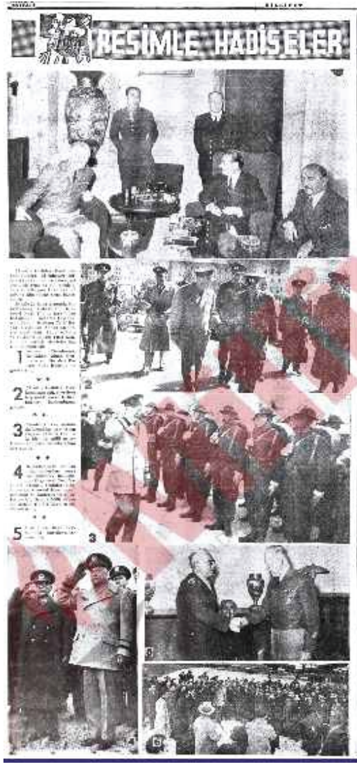
NATO Başkomutanı General Eisenhower'ın Türkiye Ziyaretinin Türk Basınına Yansıması