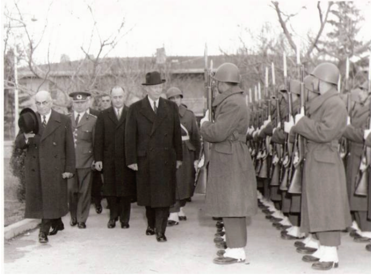
ABD Başkanı Eisenhower'ın Askeri Kutayı Selamlayışı (1959)