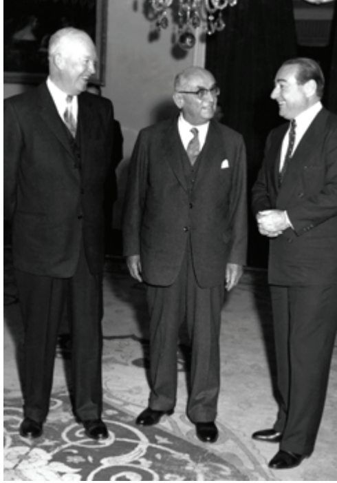
ABD BaŐkanı Eisenhower'ın Türk Yetkilileriyle GörüŐmesi