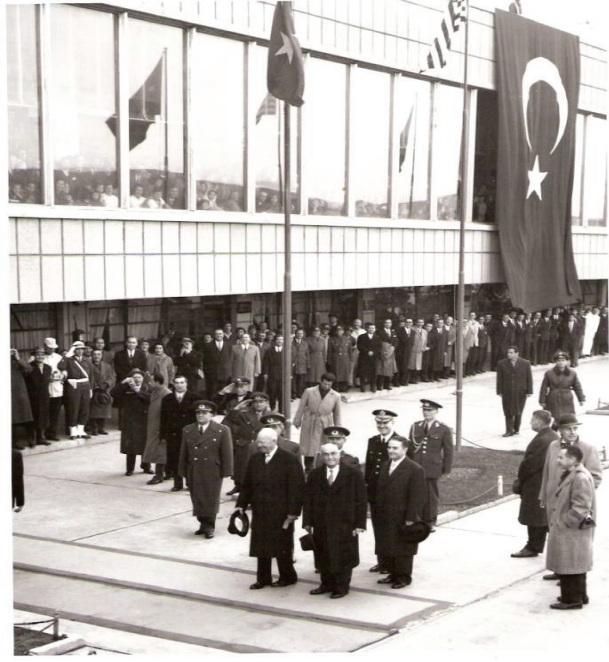
ABD Başkanı Eisenhower'ın Karşılması