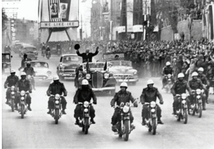
ABD Başkanı Eisenhower Ankara Halkını Selamlıyor