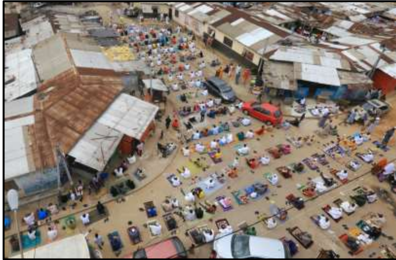
Şekil 9: Covid-19 sonrası Adjame’de fiziksel mesafeli bir dini ibadet töreni (Nacto, 2020)

Covid-19 pandemi süresince kentte kültürel, dini veya sivil toplanmalar için açık alanda yer kazanmak amacıyla sokakların araç erişimini tamamen veya kısmi olarak kısıtlama önerileri getirilmiştir. Bu gibi kullanımlar için uygun uygulama yerleri olarak; düşük hacimli konut ağırlıklı sokaklar, dar yollar, yayalaştırılmış sokaklar, ticaret ağırlıklı sokaklar veya toplu taşımasız diğer koridorlar, düşük taşıt hacimli, çok şeritli sokaklar, kamuya ait park yerleri ve açık hava garajları örnek olarak verilebilir (NACTO, 2020).