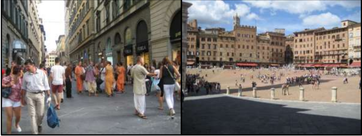
Şekil 2: Kamusal Alanda İnsan İlişkileri (Soldaki: Floransa, Sağdaki Siena, İtalya, Yazarın kişisel arşivi, 2014)

Kentte ortak kullanılan mekanların niteliğiyle kent hakkında çıkarımlar yapılabilir. Bu mekanlar yerel kültürü ve içinde geçirilen zamanı yansıtan kent halkının bir aynası gibidir. Bugünkü anlamda kentin kalbi olarak nitelendirilebilecek olan özellikle kent merkez bölgeleri, daha çok ticari işlevlerin yoğunlaştığı bölgeler olmuştur. Kentte yaşayan kişiler için kültürel, sanatsal, ticaret ve entelektüel kaynaşmanın bir merkezi olabilmesi adına bu mekanların nicel ve nitel özellikleriyle ilgili bilinç ve duyarlılık geliştirilmelidir (Oktay, 1999). Özellikle kültürel ve sosyal gelişimin belleğini de saklayan bu alanlar, sosyal ve ekonomik baskılarla beraber, bir takım değişimler içine girmiştir. Kamusal alandaki bu gibi değişimler, fiziki mekan olarak giderek azalma, ticari ve geleneksel kamusal alanların bozulması şeklinde değerlendirilebilir (Gökgür, 2018). Özellikle günümüz pandemik koşullarında, temiz hava ve kentsel alanlardaki sosyalleşme ihtiyacıyla beraber, açık kamusal alanların mekan kalitesine uygunluğunu önem kazanmaktadır (Zafer ve Erdönmez, 2021). Dolayısıyla yapı dış yüzeyleriyle sınırlandırılan ve tanımlanan, içinde kentte yaşayanların gündelik hayatını ve sosyal aktivitelerini gerçekleştirdiği, beraber aktivite yapabildikleri, kaynaşabildikleri, fiziksel ve sosyal sağlık noktasında bireye katkılar sunan, kentin fiziksel, sosyal, kültürel yapısı hakkında çıkarımlar sunan kentin kamusal alanlarının kalitesi orayı kullanan kişiler üzerinde etkilidir (Varol, 2018).