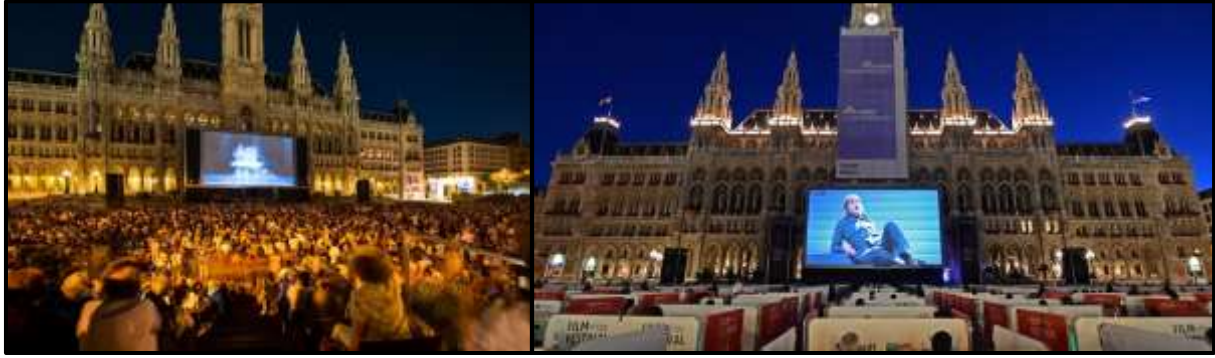
Şekil 10: Covid-19 öncesi/ sonrası Viyana Film Festivali (2019-2020 yılı) ( Soldaki Görsel: URL-4, 2019, Sağdaki Görsel: URL-5, 2020 )