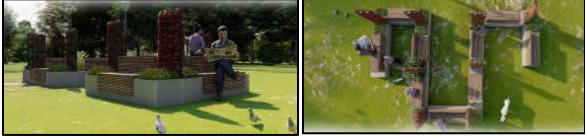
Şekil 12: Pandemi ile kamusal alanlar için sokak mobilyası tasarımı, “Reimagining Furniture for Public Spaces” yarışması 1.lik ödülü, 2020, (URL-7)

fiziksel mesafenin korunabilmesi adına kentteki oturma elemanlarının boşluklu olarak oluşturulması önerilmiştir.