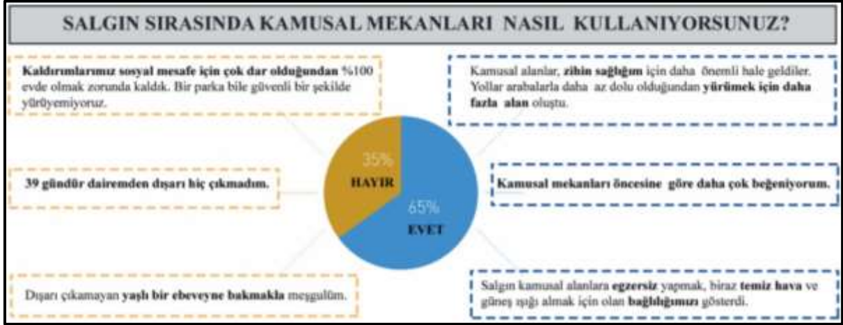
Şekil 1: Pandemi süresince kamusal mekan kullanım sıklığı (Gehl, 2020, uyarlanarak yazar tarafından hazırlanmıştır)

Yaşanan salgınla beraber gündelik yaşamdaki insan ve mekan ilişkileri her ölçekte yeniden tanımlanmıştır. Evle daha yoğun ve yakın bir bağ kurulup, ev dışında gerçekleştirilen etkinliklerin çoğu eve taşınmış, insanlarla paylaşarak kullanılan mekanlarda geçirilen süre azalmış, askıya alınmış ve kısıtlanmıştır. Mekan kullanım biçim ve süreleri köklü değişimlere uğramıştır (Güzer, 2020). Salgınla birlikte fiziksel mesafe kuralına uyma endişesiyle mevcut kamusal mekanların boyutları yeniden düşünülmektedir. Mesafenin korunamadığı kaldırımlar, birbirine yakın yerleştirilmiş kentsel mekan donatıları gibi nedenlerle virüsün bulaş riskinin aslında kapalı bir mekana göre daha az olduğu kamusal mekanların da kullanım biçimleri etkilenmiştir. Bunlar; kamusal mekanda kişi kullanımında sınırlandırmalar, kullanıcılar arasındaki fiziksel mesafeyi koruma biçimleri, kamusal mekanda kültürel hayatın sürdürülmesi, kamusal alanlardaki kapalı mekanların açık mekanlara yayılımı ve bu süreçte kamusal mekan kullanımlarına dair radikal fikirleri içeren örnek çalışmalar olarak çeşitlendirilebilir.