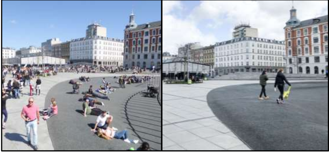
Şekil 8: Covid-19 öncesi ve sonrası kamusal alanda sosyalleşme, Israels Plads, Kopenhag, 2018-2020, (Gehl, 2020)

Covid-19 pandemi süresince kentte kültürel, dini veya sivil toplanmalar için açık alanda yer kazanmak amacıyla sokakların araç erişimini tamamen veya kısmi olarak kısıtlama önerileri getirilmiştir. Bu gibi kullanımlar için uygun uygulama yerleri olarak; düşük hacimli konut ağırlıklı sokaklar, dar yollar, yayalaştırılmış sokaklar, ticaret ağırlıklı sokaklar veya toplu taşımasız diğer koridorlar, düşük taşıt hacimli, çok şeritli sokaklar, kamuya ait park yerleri ve açık hava garajları örnek olarak verilebilir (NACTO, 2020).