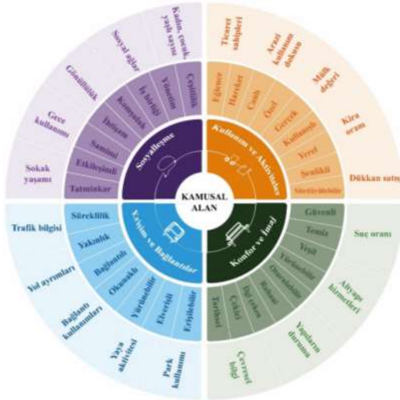
Şekil 3: Başarılı bir kamusal alanın ölçütleri, PPS (URL-1, uyarlanarak yazar tarafından hazırlanmıştır)

Kamusal alanda mekan kalitesinin ölçülebilmesi için Nasar, Gehl, PPS (Project for Public Spaces), Roger Tym&Partners gibi pek çok grup farklı parametreler belirlemiştir. Amerika Birleşik Devletleri merkezli teknik yardım, araştırma, eğitim, planlama ve tasarım önerileri sunan ‘‘Kamusal Mekanlar için Proje Şirketi’’ PPS, (Project for Public Spaces Inc.) 1000’den fazla kamusal alanda yapmış olduğu araştırmaları sonucunda başarılı bir kamusal alanın dört temel işleve sahip olması gerektiğini savunmaktadır. Bunlar: Erişim ve bağlantılar; amaç ve aktiviteler; rahatlık- imaj ve sosyalleşmedir. (İnceoğlu ve Aytuğ, 2009).