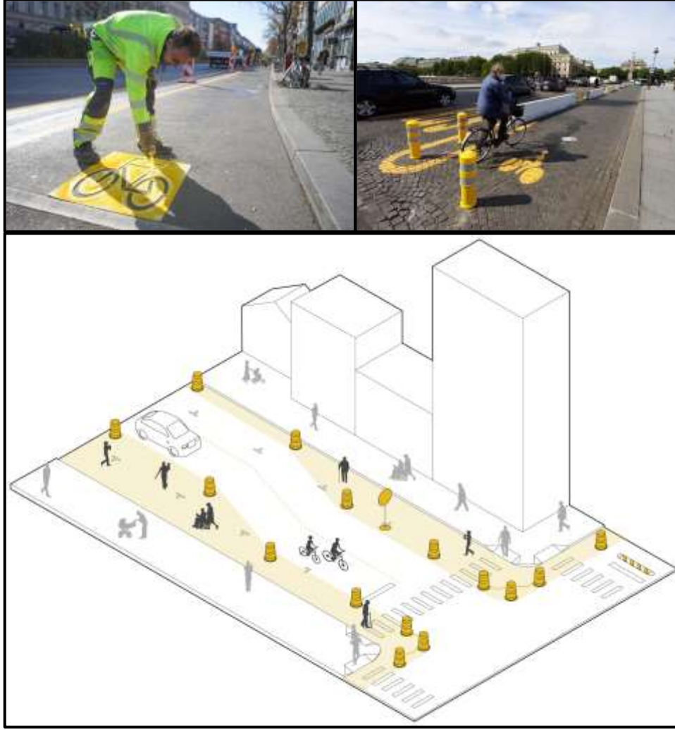
Şekil 6: Salgın süresince araç ve yaya hareketleri için uyarıcı elemanlar/tabelalar (Nacto, 2020)

Covid-19 salgını ile trafiğin yoğunluğunu azaltmak ve fiziksel mesafeyi korumak adına bisiklet ve yayalar için yürüyüş yolları oluşturulması önem kazanmıştır. Pandemi sonrası kaldırımların genişletilmesi, var olan bisiklet yollarının geliştirilmesi ve yaya erişilebilirliğinin desteklenmesi gerekmektedir. Kamusal mekandaki yapı girişlerinde insan kalabalıklığının önlenmesi için 1,5 m kuralına uygun işaretlemeler eklenmiştir. Pandemi sonrası tasarlanacak yerlerde buna uyum sağlamak adına daha fazla alan eklenmesi de söz konusu olabilir (Özcü ve Atanur, 2020). Salgınla beraber kamusal mekanda daha önce bir sorun oluşturmayan ‘kalabalıklık’ kavramı düşünölmeye başlanmış ve bu mekanları kullanan kişi sayısına sınırlandırmalar getirilerek denetimli girişler sağlanmışır. Bir kamusal alanda bulunacak kişi sayısı fiziksel mesafe kurallarına göre belirlenip, mekana denetimli ve kontrollü olarak kullanıcı giriş-çıkışları