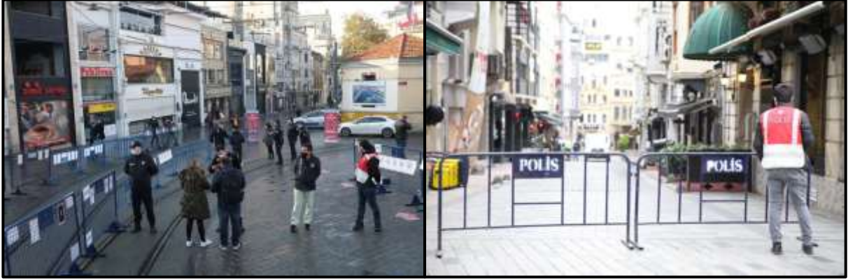
Şekil 7: Kamusal Alanda Denetimli Giriş-Çıkışlar, İstanbul

sağlanmıştır. Böylece ortaya çıkabilecek olan kalabalıklık durumu önlenip, kullanıcıların birbirinden daha uzak kalarak kamusal alanda bulunmaları sağlanmıştır.