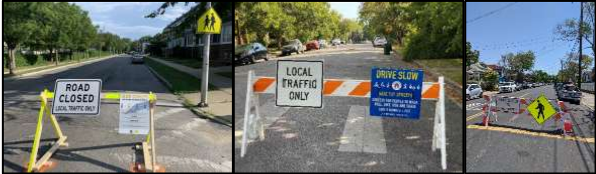
Şekil 4: Salgın süresince sokaklarda trafiğin yavaşlatılması (NACTO, 2020)

Covid-19 salgını ile bir takım değişimler içine girmiştir. Pek çok kentte özellikle yaya hareketleri azalmış ve trafik pek çok noktada yavaşlatılmıştır. Kentlerin bazı noktalarında insanların güvenle yürüyebilmesi, bisiklete binmesi ve koşabilmesini teşvik etmek için trafik hacmini ve hızının azaltılması önerileri hayata geçirilmiştir. Özellikle salgın süresince sokakları zihinsel, fiziksel ve immünolojik sağlığın anahtarı olarak tanımlayan NACTO, Sokakların yaşanan bu salgın karşısında nasıl olanaklar yaratabileceğini gösteren “paylaşımlı, yavaş, açık ve ferah sokak” gibi alternatif sokak tasarım rehberleri yayınlamıştır (NACTO, The National Association of City Transportation Officials, 2020).