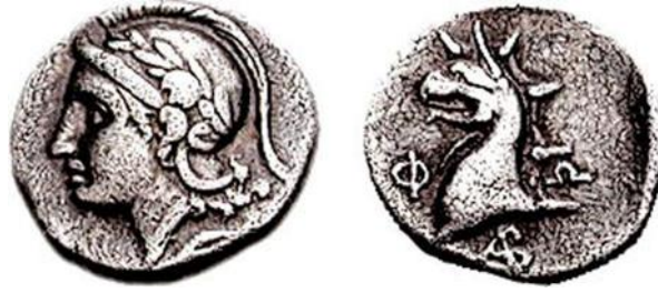
Fig. 5. Phokaia Athena sikkesi

( https://www.wildwinds.com/coins/greece/ionia/phokaia/Winterthur_3102.jpg ) (Alıntı tarihi: 11.12.2021)