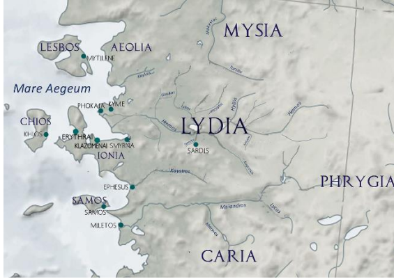
Fig. 2. Batı Anadolu ve Nehirleri (Düzenleyen: S. Arıcı)