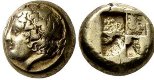
Fig. 6. Phokaia Dionysos sikkesi

( https://www.wildwinds.com/coins/greece/ionia/phokaia/Winterthur_3102.jpg ) (Alıntı tarihi: 11.12.2021)