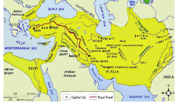
Fig. 3. Phokaia-Sardeis hattı ve Kral Yolu

( https://www.shorthistory.org/ancient-civilizations/mesopotamia/persian-empire/the-organization-and-economy-of-the-persian-empire/ ) (Alıntı tarihi: 11.12.2021)