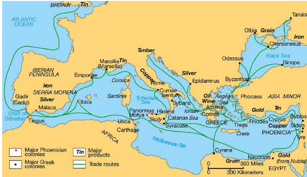
Fig. 4. Büyük Kolonizasyon rotaları

( https://www.shorthistory.org/ancient-civilizations/mesopotamia/persian-empire/the-organization-and-economy-of-the-persian-empire/ ) (Alıntı tarihi: 11.12.2021)