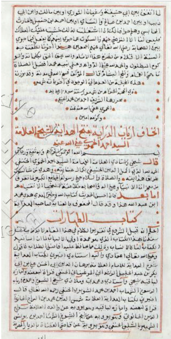
Süleymaniye Kütüphanesi, Esad Efendi Bölümü, nr. 3631, vr. 113 b . Son Sayfa.