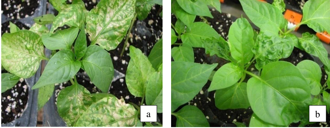
Şekil 3. PVY (0,1,2) patotipinin biber hatlarında oluşturduğu belirtiler a: Yapraklarda nekroz b: Yapraklarda kabarcıklanma ve şekil bozukluğu

Figure 3. Symptoms generated by PVY patotype (0,1,2) on pepper lines a. necrosis on leaves b. Leaf blistering and deformation