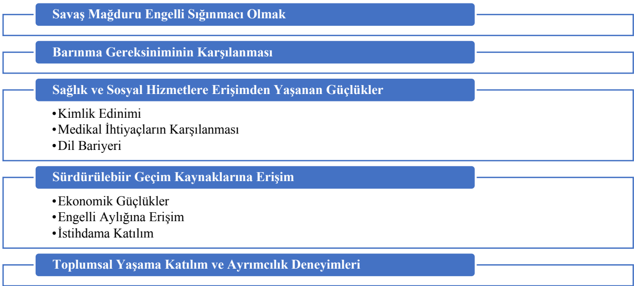
Şekil 1: Anlam birimleri/temalar

Veriler MAXQDA 2020 ile kodlanmış ve tematik analiz ile çözümlenmiştir. Nitel analiz kapsamında katılımcıların deneyimlerinin analizi için her bir engelli sığınmacının ses kaydının deşifreleri kullanılmıştır. Elde edilen verilerin deşifreleri için; görüşme sırasında eşlik eden Suriye/ Türkmen asıllı bir tercümanın desteğiyle, veri kaybı yaşamamak adına ses kayıtları tekrar gözden geçirilmiştir. Arapça bilen bir Türk tercümanla da görüşmelerin deşifresi üzerinden geçilmiş ve tercümedeki olası hataların önüne geçilmeye çalışılmıştır. İki ayrı tercüman kullanımı sağlanarak veri kayıplarının önüne geçilmek istenmiş ve güvenilirliğin de sağlanması amaçlanmıştır. Verilerin değerlendirilmesi sonucunda elde edilen temalar aşağıda Şekil 1.'de görsel olarak ifade edilmiştir: