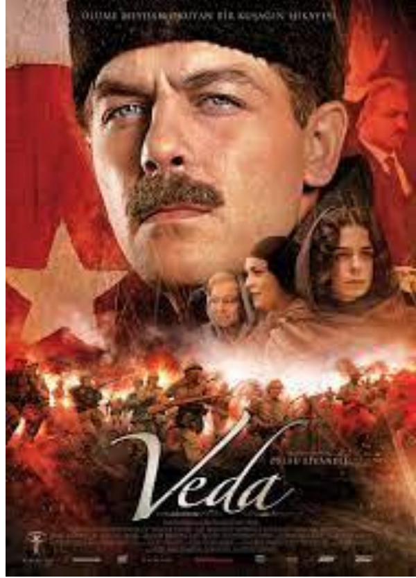
Resim 1 "Mustafa" film afişi