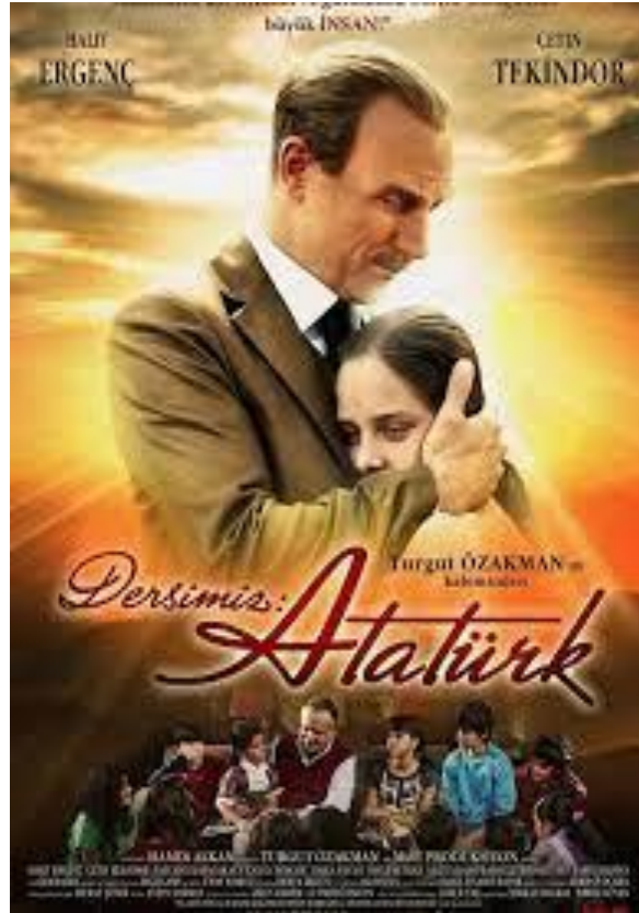
Resim 3 "Dersimiz Atatürk" film afişi