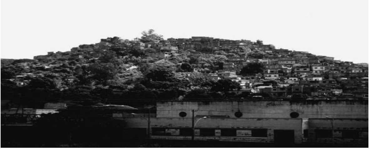
Fotoğraf 1. Rio'daki Norte bölgesindeki bir tepe favelası, Morro dos Telegrafos