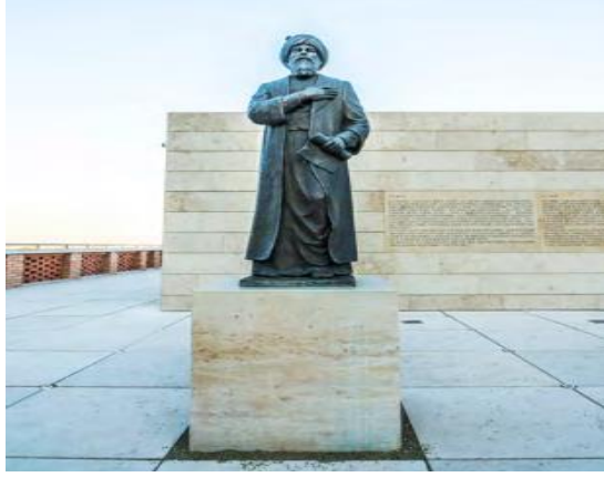
Ek-7: Restorasyon sonrası Gül Baba heykeli 2018