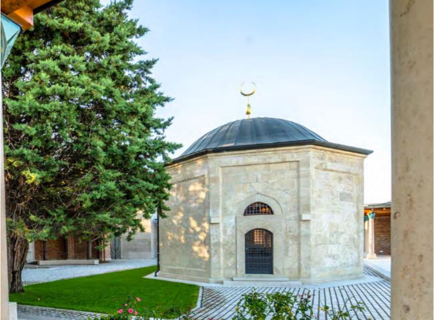
Ek-8: Restorasyon sonrasında Gül Baba Türbesi 2018 (TİKA: E.T. 03.12.2021)