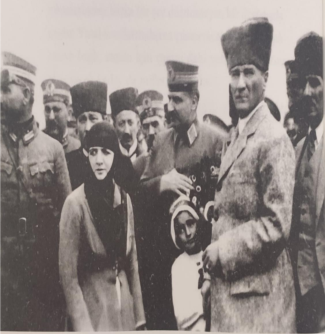
30 Ağustos 1924 – Büyük Taarruz'un ikinci yıl dönümü vesilesiyle Mustafa Kemal Atatürk'ün Dumlupınar'ı ziyareti