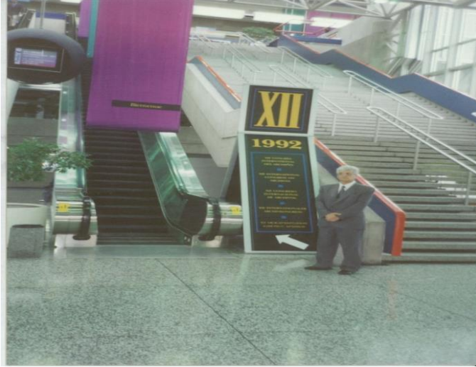
Görsel 5. 6-1. Eylül 1992 tarihinde Montreal’de düzenlenen XII. Uluslararası Arşiv Kongresi’nde.