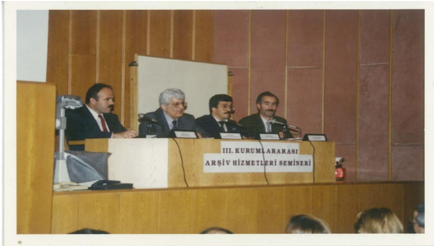
Görsel 3. 3.Kurumlararası Arşiv Hizmetleri Semineri.