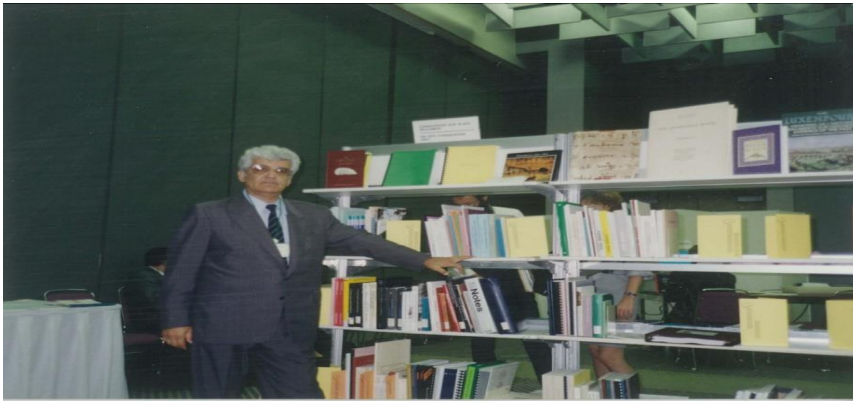
Görsel 4. 6-1. Eylül 1992 tarihinde Montreal’de düzenlen XII. Uluslararası Arşiv Kongresi’nde Türkiye Cumhuriyeti Devlet Arşivleri yayınları ile.