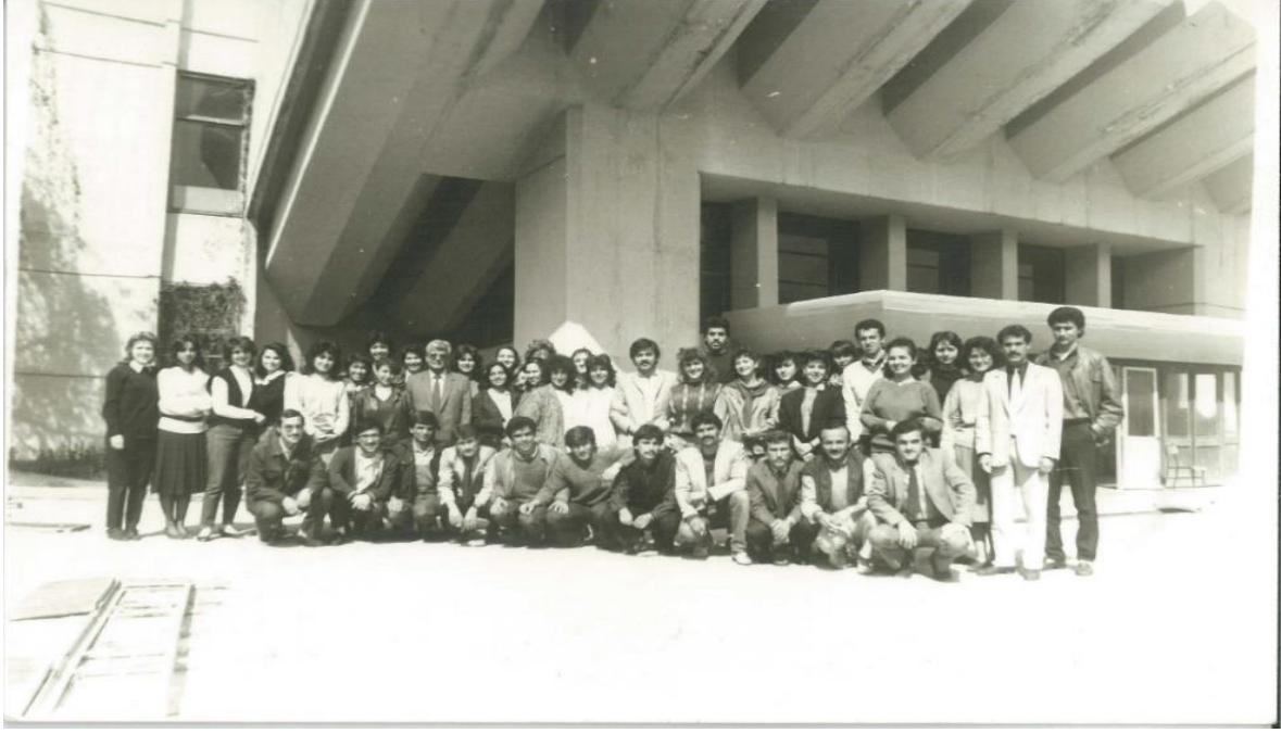
Görsel 2. Hacettepe Üniversitesi Beytepe Kampüsünde Yıldız Anfi önünde Kütüphanecilik Bölümü öğrencileriyle.