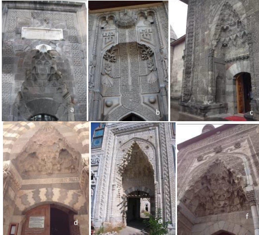
Şekil 6. Anadolu Selçuklu Medreseleri taş kapı örnekleri: a) Kayser Çifte Medrese, b) Konya, İnce Minareli Medrese, c) Erzurum, Yakutiye Medresesi, d) Kırşehir, Cacabey Medresesi, e) Sivas, Gök Medrese, f) Sivas, Çifte Minareli Medrese (Yazarlara ait fotoğraf arşivi 2011- 2018).