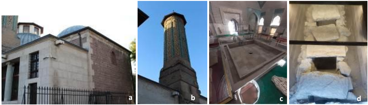
Şekil 2. İnce Minareli Medrese'nin a) kuzey cephesi, b) minaresi ve c) avluda yer alan havuz ve d) su kanalı.

18 Temmuz 1811 tarihinde bir restorasyon geçirmiş ve büyük kubbe, yandaki iki küçük kubbe ile birlikte tamir edilmiştir. 1954 yılında bir restorasyon çalışması yaptırılmış ve yıkılan duvarlar örülerek yapı bugünkü görünümünü kazanmıştır. 1956 yılından itibaren Taş ve Ahşap Eserler Müzesi olarak kullanılmaya başlanan medrese, 1959 yılında tekrar bir restorasyon geçirmiştir (Erdemir 2009a, s. 74). Bu restorasyon ile yapının çevresi temizlenmiş etrafı duvarla çevrilmiştir. Son olarak 2002 yılında, yapının özellikle iç mekânında bakım, tadilat işleri yapılmış ve mescit kısmı tamamlanmıştır (Şekil 2). Yine, 2002 yılı onarımlarında, ana eyvanın tabanından havuza su taşıyan orijinal künklerle rastlanmış ve cam bir yüzey ile bu künklerin sergilenmesi sağlanmıştır (Erdemir 2009a, s. 74-75) (Şekil 3). Kesme taş ile inşa edilen doğu cephesi ve portalı günümüze büyük oranda bozulmadan gelebilmiştir.