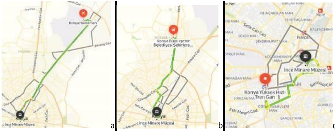
Şekil 5. İnce Minareli Medreseye ulaşım olanakları; a) havaalanı ulaşımı: 17 km, b) şehir terminalinden ulaşım: 11 km, c) tren garı ulaşımı: 3,7 km (Yandex Haritalar 2020)