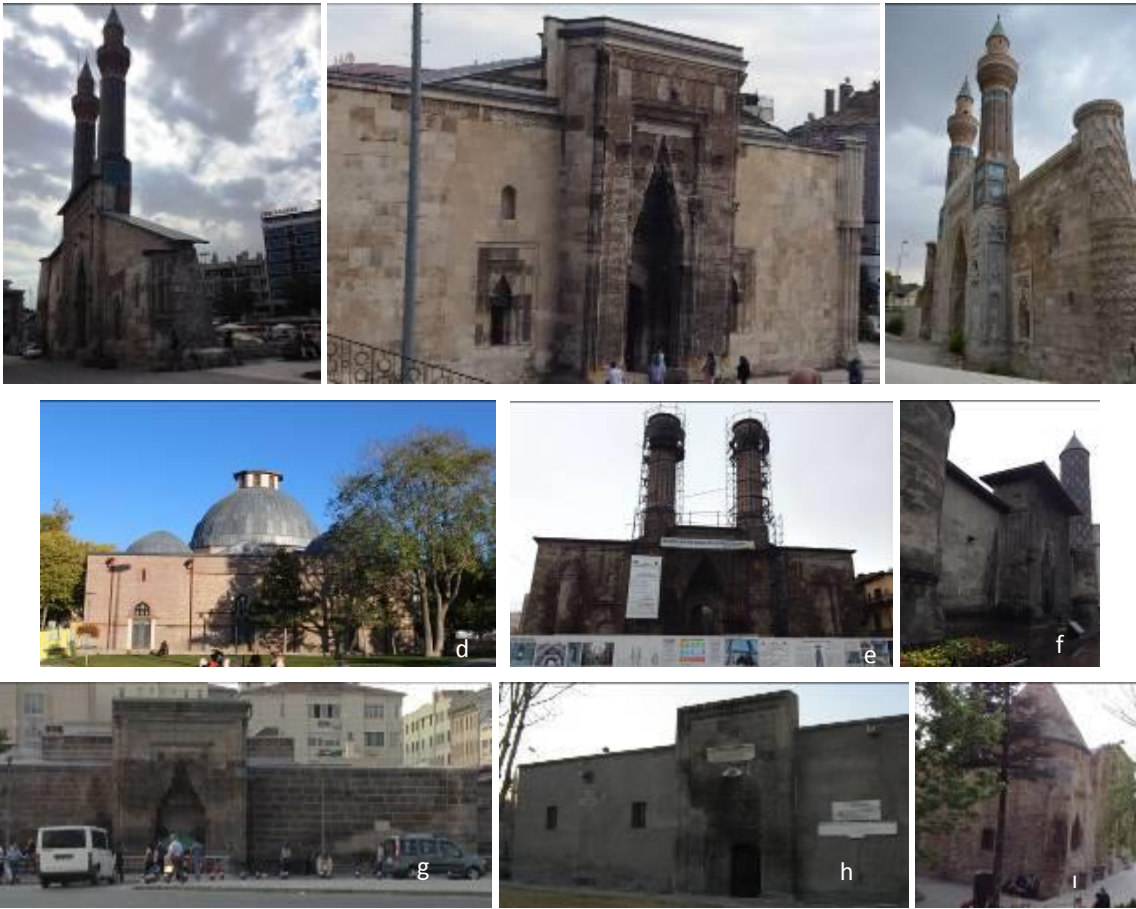
Şekil 1. a) Sivas, Çifte Minareli Medrese, b) Sivas, Buruciye Medresesi, c) Sivas, Gök Medrese, d) Konya, Karatay Medresesi, e) Erzurum, Çifte Minareli Medrese, f) Erzurum, Yakutiye Medresesi, Kayseri, Sahibiye Medresesi, h) Kayser, Çifte Medrese, i) Kırşehir, Cacabey Medresesi