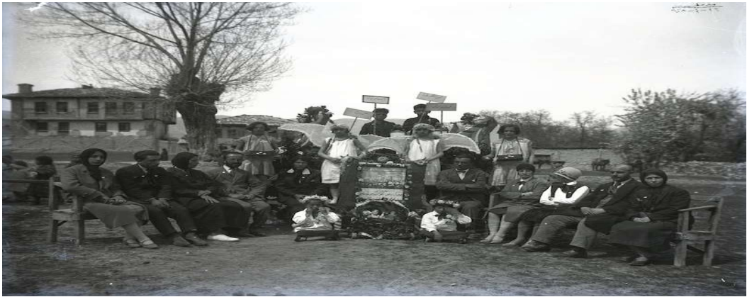
“Mudurnu’da Kutlamalar”, MDKA, 23.04.1928, Envanter No: AIB_Cn_0787.

Altındaki fotoğrafta ise aynı gün Mudurnu’daki kutlamalar sırasında okul bahçesinde “Gürbüz olmak, hürmet, temiz ve muntazam gıda istiyoruz” pankartlı çocuklar görülmektedir. 56 Kutlamalarda melek figürlü kız çocuklarının etkin roller üstlendiği anlaşılmaktadır.