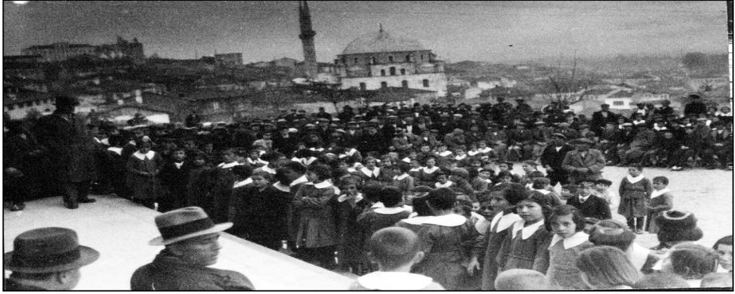
“Halkevi Önünde Kutlamalar”