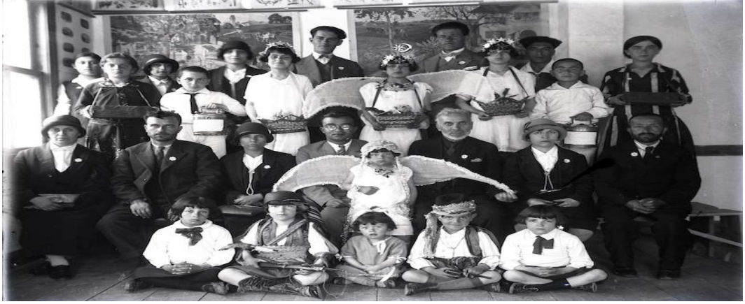
“Mudurnu’da Kutlamalar”

temsil, musiki, halk oyunları icrası ile şiir ve söylevlerin yer almıştı. Ayrıca muhtelif kurumlar için yardım toplamak üzere piyango çekilişi yapılmıştı. 55