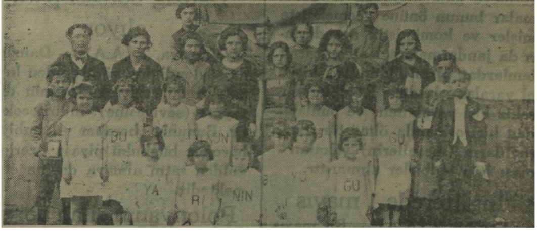
“Bolu’da Çocuk Bayramı Şenlikleri”, Ulus , 3 Mayıs 1935, s.5.

Bolu gazetesinde Ertuğrul Şevket kaleme aldığı bir yazısında günün anlam ve önemine ilişkin olarak şunları söylemişti: 60