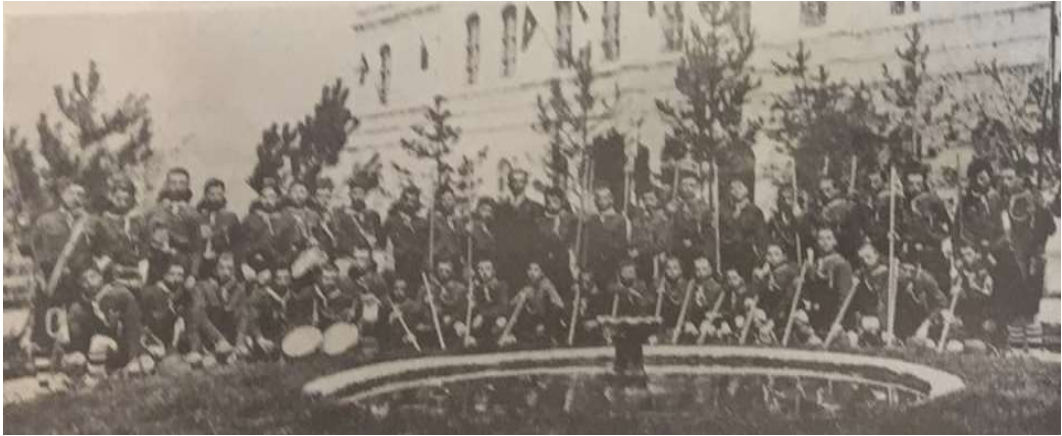
“23 Nisan 1935’te Bolu Ortaokulu İzcileri Mektep Bahçesinde”, Bolu Ortaokulu Dergisi , Resimli Ay Basımevi, S.1, İstanbul 1935-1936, s.36.