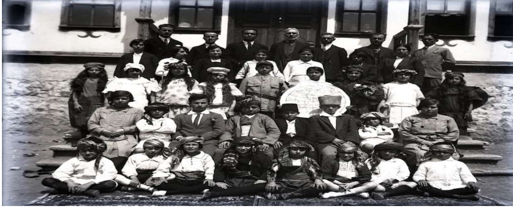
“Mudurnu’da Kutlamalar”, MDKA, 23.04.1931, Envanter No: AIB_Cn_0964.

öğrenci elinde paralel ve meridyenleri gösteren bir dünya resmi, bir başkası ise çiçek tutar vaziyette yer almıştı. 57