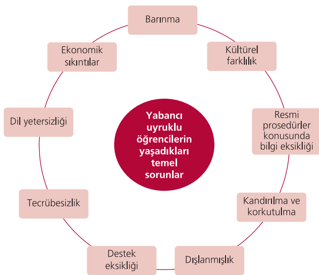
Şekil 2. Öğrencilerin yaşadıkları temel sorun alanlarına yönelik görsel.

Bir diğer alt tema ise barınma olarak belirlenmiştir. Görüş bildiren katılımcılar barınma sorununu çevreyi bilmeme, kala-