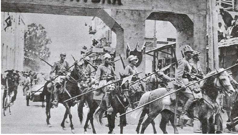
Hatay'a Giren Türk Süvarileri (6 Temmuz 1938)