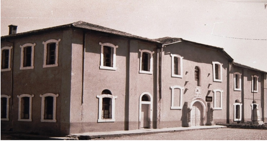
Kırıkhan Kurtuluş İlkokulu (Sarı Okul)

Nüfus artışına paralel olarak Hatay ilkokullarında öğrenci ve öğretmen sayıları düzenli bir artış göstermiştir. 1959-1960 öğretim yılında öğrenci sayısı 19.317, öğretmen sayısı 164; 1990-1991'de öğrenci sayısı 170.352, öğretmen sayısı 4881 olmuştur. 2017-2018 öğretim yılında ise öğrenci sayısı 130.476'ya inerken öğretmen sayısı 7554'e yükselmiştir. 18 Eldeki verilere göre 1990-1991 öğretim yılında ulaşılan öğrenci sayısı en yüksek seviyedir. 19 Hatay'da bağımsız eğitimli köy ilkokulu 1940-1941 öğretim yılında 1723 öğrenciyle başlamıştır. İlk Türk özel okulu 1959-1960 öğretim yılında 38 öğrenciyle öğretime başlamış, ilk yatılı bölge ilkokulu ise 1965-1966 öğretim yılında açılmıştır. 20