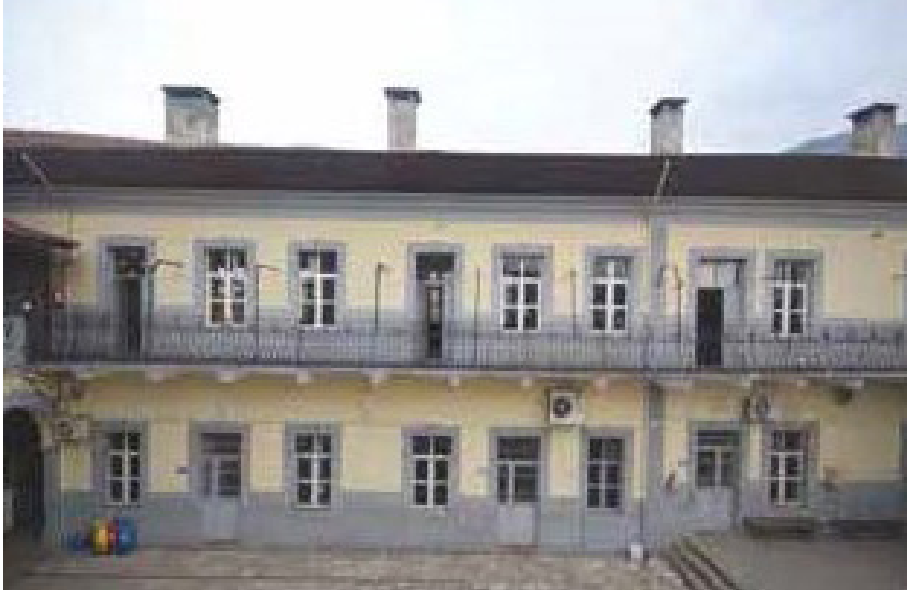
Fevzi Çakmak İlkokulu (Ecole des Soeurs)

1939-1940 öğretim yılı itibariyle Hatay'da iki ayrı yabancı okul vardı: Biri İtalyan diğeri İngiliz ilkokulu. İtalyan ilkokulunda 18'i erkek, 12'si kız olmak üzere 30 öğrenci öğrenim görürken İngiliz ilkokulunda ise dördü erkek, üçü kız olmak üzere yedi öğrenci öğrenim görmekteydi. Söz konusu iki özel ilkokuldan İngilizlere ait olanı aynı yıl kapanmıştır. İtalyan ilkokulunun öğrenci sayısı giderek azalmış ve 1967-1968 öğretim yılında o da kapanmıştır. 17