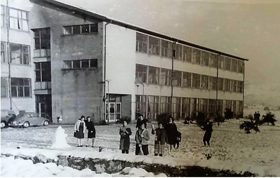
Hatay Kız İlköğretmen Okulu (22 Ocak 1971)