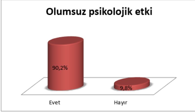
Grafik 7: Yaşanmış Olayların Mecburi Göçkünler Üzerindeki Olumsuz Psikolojik Etkisi.

direkt kendilerine istinat etmek çalışmamız açısından büyük önem ifade etmiştir. Ankete katılan 450 kişiden 448'nin yanıtladığı dokuzuncu sorunun sonuçlarına göre göç sürecinin psikolojik etkilerinin hali-hazırda da güncel bir sorun olduğu ortaya çıkmıştır.