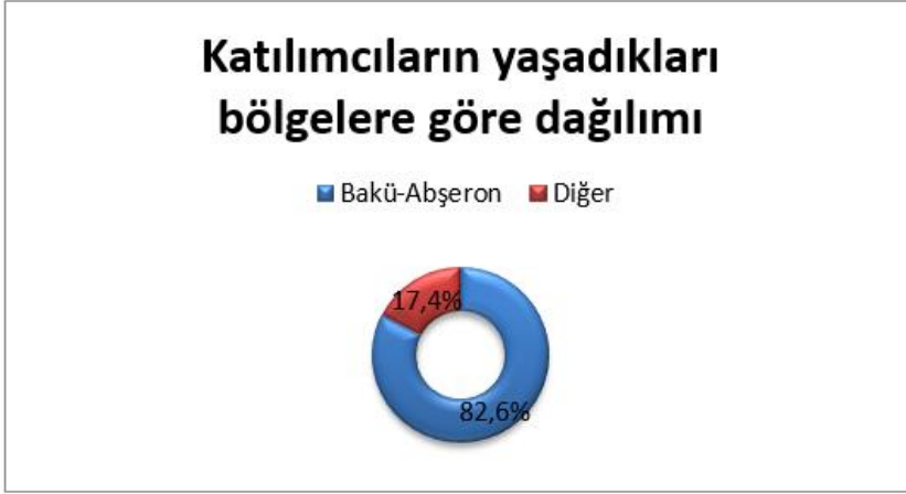
Grafik 2: Katılımcıların Yaşadıkları Bölgelere Göre Dağılımı.