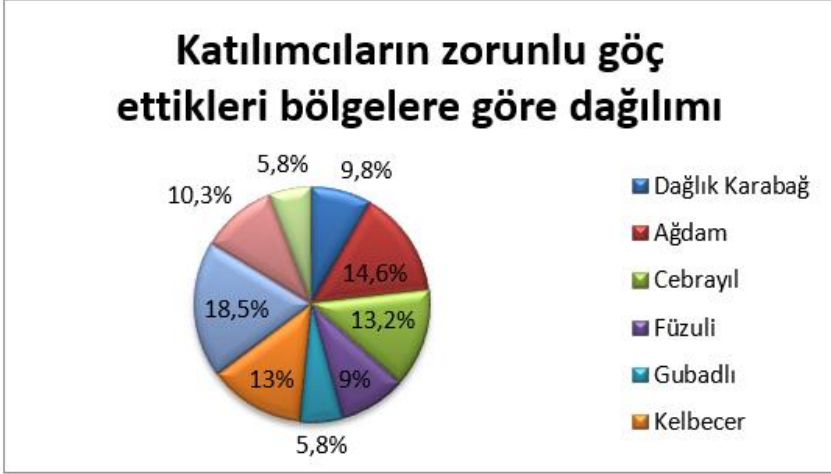
Grafik 1: Katılımcıların Zorunlu Göç Ettikleri Bölgelere Göre Dağılımı.

İkinci soruya verilen yanıtlara esasen katılımcıların bölgelere göre katılım oranı şu şekilde olmuştur.