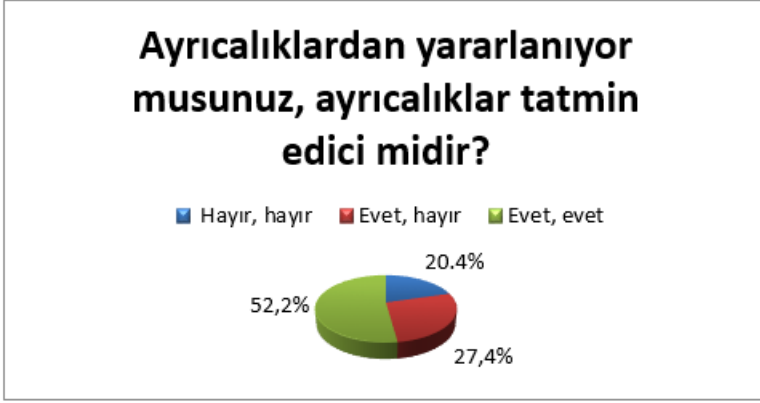
Grafik 5: Mecburi Göçkünlerin Devletin Onlara Tanıdığı Ayrıcalıklara İlişkin Tutumu.

Geri dönüş arzusunun değerlendirilmesi bağlamında belirli düzeyde istinat edebileceğimiz bir diğer soru ise anket çalışmasının altıncı sorusudur. Katılımcıların çatışmanın savaş veya görüşmeler yolu ile çözülmesine dair ileri sürdükleri görüşler de oldukça ilgi çekicidir. Uzun bir süreye yayılan görüşmeler sürecinin başarısızlıkla sonuçlanmasına karşılık olarak Azerbaycan toplumunda uluslararası sisteme yönelik güven sarsılmıştır. Özellikle mecburi göçkünlerin kayıtsız-şartsız geri dönmelerine dair uluslararası teşkilatların çok sayıdaki karar ve önerilerinin hiçbir nihai sonuca bağlanmaması savaş eğilimlerini güçlendirmiştir. Bu eğilim mecburi göçkünler arasında da ciddi oranda olmuştur. Örneğin ankete katılan 450 mecburi göçkünden 447'sinin yanıtladığı soruya göre, onların % 69,4'ü çatışmanın savaş yoluyla; %30,6'sı ise görüşmeler yolu ile çözülmesinin taraftarı olmuştur.