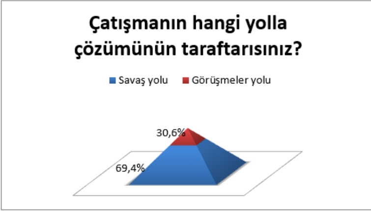
Grafik 6: Mecburi Göçkünlerin Çatışmanın Çözüm Sürecine Dair Tutumu.

Tecrübelerle dayanarak görüşmeler sürecinin çatışmanın çözümü konusunda etkili sonuçlarının olmaması, savaşın kesin çözüm olacağına dair bir görüş oluşturmuştur. Çatışmanın biran önce çözüme kavuşturulması ve katılımcıların kendi topraklarına dönme isteği doğru orantılı olmuştur. Katılımcıların % 30,6'sı ise savaşın yıkıcı özelliklerini dikkate alarak görüşmeler yolunu seçmiştir. Bununla birlikte savaşın sürdüğü arifede ankete katılan mecburi göçkünler savaştan önceki süreçte ankete katılanlara kıyasla daha fazla savaş yoluna eğilimli olmuştur. Bu durum, sürecin oluşturduğu psikolojinin ve askeri operasyonların başarısının zafere yönelik inancı beslemesinden kaynaklanmıştır. Toplumun sadece mecburi göçkün kısmında değil, aynı zamanda diğer vatandaşları arasında da savaşın kazanılacağına dair inanç ve özveri Azerbaycan'ın cephedeki başarılarının temelini oluşturmuştur. Bu bağlamda, savaşa eğilimli olmak belirli düzeyde olumsuz olarak değerlendirilse de anket çalışmasının yapıldığı dönemin gerçeklikleri de dikkate alınması gerekmektedir.