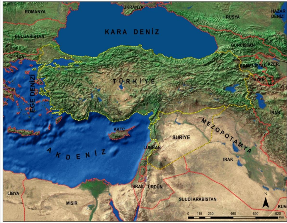
Şekil 1: Çalışma Alanının Lokasyon Haritası