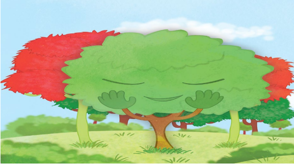
Şekil 8: “Minik Meşe’nin Endişesi” Hikâyesinin Görseli

Gerek Şekil 8’de görseli verilen “Minik Meşe’nin Endişesi” gerekse de Şekil 9’da görseli verilen ve üzerinde fil resmi olan kazağını çok seven Mustafa’nın kendisine küçük geldiği halde kazağı saklamak istemesini konu edinen “Filli Kazağı Paylaşmak” hikâyelerinde yazı-resim uyumu ile birlikte resimler hikâyeyi canlandırmaktadır.