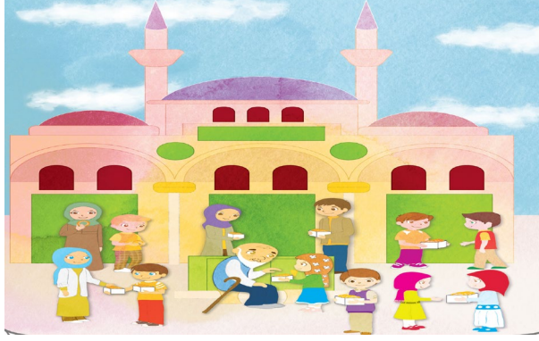
Şekil 6: "Kandil Simidi" Hikâyesinin Görseli

Yine Şekil 7'de görseli verilen "Akıllı Karınca ile Bilgin Ağaç" hikâyesinde, hikâyenin kahramanı bir karınca olmasına rağmen resimlerde karınca, ağacın gövdesiyle aynı renkte çizilmiştir. Bundan dolayı karıncayı hemen görmek ve bulmak pek mümkün değildir. Buna karşın, üzerindeki gözlerle ilgi çekici olan ağaç ve canlı renkleri nedeniyle ağacın etrafındaki diğer hayvanlar daha ön plana çıkmıştır. Hâlbuki bu resimde de perspektif kuralından istifade edilerek karınca, hikâyenin asıl kahramanı olduğu için gerek rengi gerekse boyutuyla daha net hale getirilebilirdi. Çünkü resimden beklenen yazarın sözle anlattığını görsel olarak da net bir biçimde yansıtabilmesi, dilsel kurguyu tamamlaması, metne yeni bir anlam katmasıdır. 51 Bu resimde ayrıca metin ve resim arasında da bir uyumsuzluk vardır. Zira hikâyede karıncanın gece karanlığında ay ışığında bir ağaç üzerinde dolaşırken "bu karanlıkta ay ışığı olmasa ne yapardım" diye tefekkür ettiği ve bunun arkasından Allah'ın faydasız hiçbir şey yaratmadığı üzerine ağaçla aralarında geçen bir diyaloga yer verilmiştir. Ancak hikâyenin resminde ne karanlık ne de ay vardır. Aksine resimde ilk göze çarpanlardan biri sapsarı bir şekilde parlayan güneştir. Metin ve görsel arasındaki bu uyumsuzluğun hikâyenin verdiği mesaja katkı sağlaması bir yana okuyucu ya da dinleyici üzerindeki etkisini azaltması kaçınılmazdır.