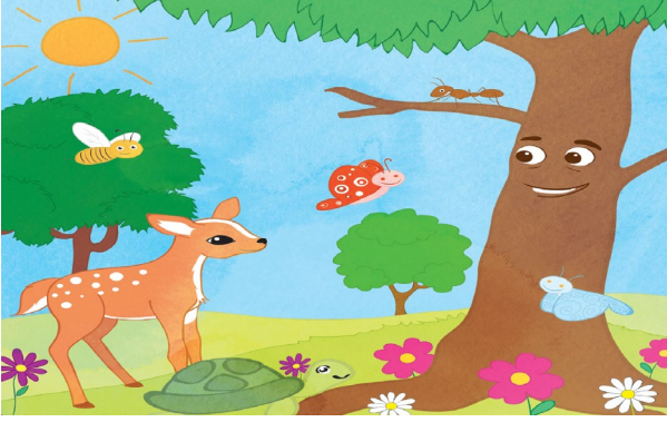
Şekil 7: “Akıllı Karınca ile Bilgin Ağaç” Hikâyesinin Görseli

Etkinlik kitaplarında yer alan diğer hikâyelerin resimlerinde ise hikâyelerin metne uygun bir şekilde canlandırıldığı, sıcak renkler kullanıldığı, zaman zaman nesnelere bilinenden farklı renkler verilerek çocukların yaratıcılıklarının harekete geçirilmesinin hedeflendiği görülmektedir. Ayrıca “Minik Meşe’nin Endişesi” hikâyesinin resimlerinde olduğu gibi anlatıdaki endişe, üzüntü, mutluluk gibi sözcüklerin soyut dünyasını görselleştirmeyi başardığı söylenebilir. Ayrıca ağaçlara gözler çizerek çocuklardaki antropomorfik özelliğe vurgu yapıldığı ve onların seviyelerine inildiği görülmektedir.