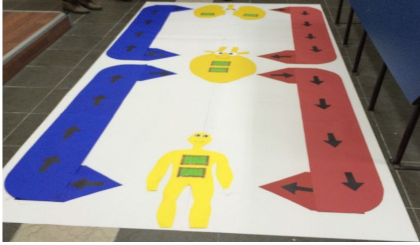
Şekil 5: Beşinci grubun hazırladığı dolaşım sistemini sembolize eden materyal

taşıyan çocuğu kalbe geri gönderir. Etkinlikte, dolaşım sistemini sembolize eden ve dramada kullanılmak üzere hazırlanan materyal Şekil 5'te verilmiştir.