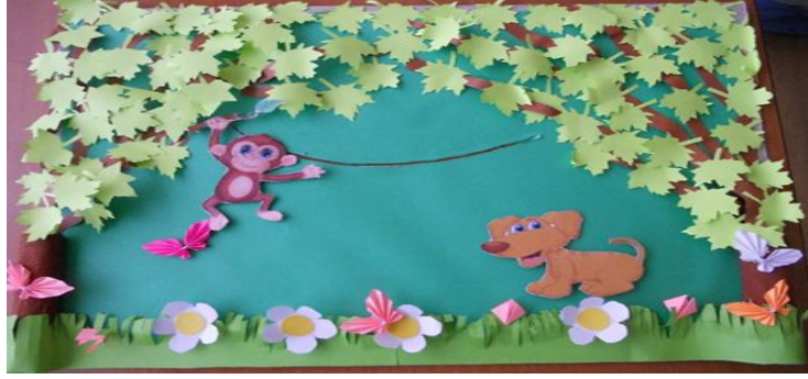
Şekil 1: Birinci grubun tasarladığı hikâye kartları ve etkinlikte kullandığı hikâye

Bir varmış, bir yokmuş. Kuki, ormanda sahibiyile gezerken kaybolmuş. Ormanda evinin yolunu bulabilmek için ormanda dolaşmaya başlamış. Ormanda gezinirken “Şişşt, köpekçik! Ne yapıyorsun tek başına burada?” diye bir ses duymuş. Kuki, çok korkmuş ve çimenlerin arkasına saklanıvermiş. Kuki, “Kim var orda?” diye bağırmış. Ağaçların arasında sallanarak maymun gelmiş. “Köpekçik, benden korkmana gerek yok. Benden zarar gelmez sana.” demiş. Kuki saklandığı yerden çıkmış ve maymuna “Sen de kimsin?” demiş. Maymun, “Ben bir maymunum. Böyle ağaçtan ağaca gezerim, muz da çok severim. Ya sen ne arıyorsun burada?” demiş. “Bende Kuki! Sahibimle ormanda gezinirken kayboldum. Evimin yolunu bulmaya çalışıyorum.” demiş Kuki. Maymun, “Bu yolu takip edersen evine ulaşabilirsin. Çünkü benim geldiğim yönde ev yoktu.” demiş. Kuki, maymuna teşekkür etmiş ve vola devam etmiş.