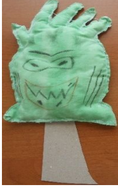
Şekil 3: Üçüncü grubun etkinlikte kullanılmak üzere tasarladığı kuklalar

Bana mikrop derler. İnsanları hasta etmek benim görevim. Pis yerler benim evim, pis yerleri çok severim. Herkesin dokunduğu yerde ben varım. Nereler olduğunu merak ediyor musun? Herkesin dokunduğu yerleri bir düşünelim. Mesela herkesin dokunduğu para en sevdiğim! Toplu taşıma araçlarında herkesin tuttuğu eşyalarda, yere düşürdüğün her şeyde hep ben varım. Ellerini yıkamayı çok severim.