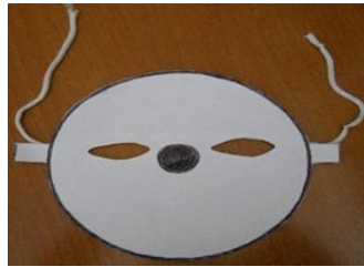
Şekil 6: Altıncı grubun etkinlikte kullandığı materyaller

Merhaba ben bir kurbağa yumurtasıyım. Kurbağaya pek benzemiyorum değil mi? Biraz zamana ihtiyacım var sadece. Büyüyüp değişeceğim.