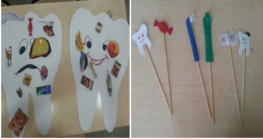
Şekil 2: İkinci grubun etkinlikte kullanılmak üzere tasarladığı materyaller

İkinci grupta bulunan Okul Öncesi öğretmen adaylarının, kartondan sağlıklı ve çürük diş tasarladıkları ve dişlerin sağlıklı olmasını ve çürümesini sağlayan etmenleri dişlerin üzerine yapıştırdıkları bir etkinlik tasarladıkları görülmüştür. Öğretmen adayları planladıkları bu drama etkinliğinde, ayrı ayrı çubukların üzerine sağlıklı ve çürük diş, mikrop, diş macunu ve fırçası, şeker yapıştırılmış materyaller, ikili diyaloglar oluşturulacak şekilde çocuklara dağıtılır ve çocukların ellerindeki materyallere göre konuşmaları istenir.