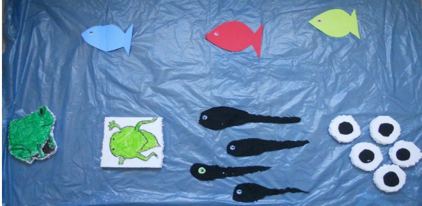
Şekil 7: Yedinci grubun etkinlikte kullandığı kurbağanın başkalaşım sürecini gösteren pano

Yedinci grupta bulunan öğretmen adaylarının kurbağanın başkalaşım evrelerini kuklalarla canlandırabilecekleri bir etkinlik planladıkları görülmüştür. Ayrıca, öğretmen adaylarının, kurbağanın başkalaşım sürecini bir bütün olarak görebilecekleri bir pano hazırladıkları da görülmüştür. Drama ve dramada kullanılmak üzere hazırlanan materyaller Şekil 7 ve Şekil 8'de verilmiştir.