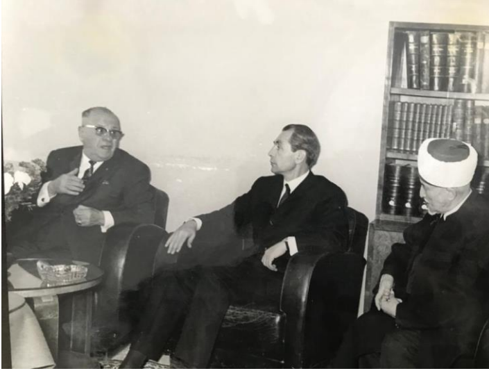
1. Cumhurbaşkanı Cevdet Sunay'ın Diyanet İşleri Başkanlığını Ziyareti Esnasında: Cumhurbaşkanı, Hakses ve Devlet bakanı Hüsamettin Atabeyli (ortada)