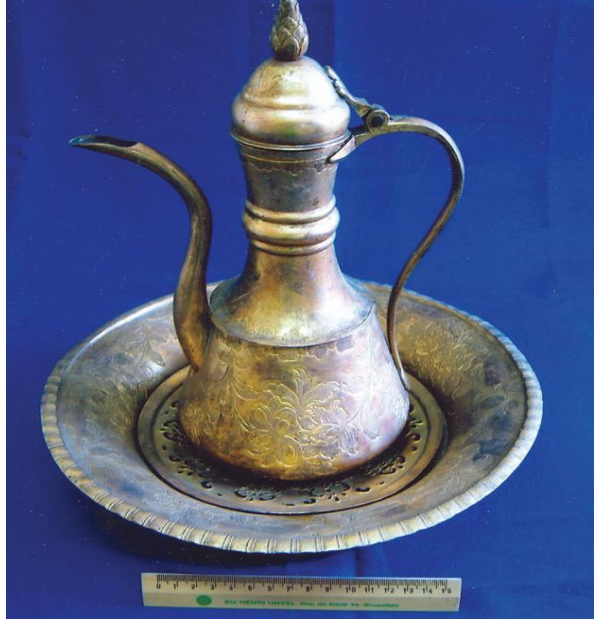
Fotoğraf 4. Tombak ibrik-leğen, Topkapı sarayı, (Tuncel 2006: 211).