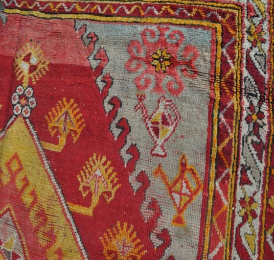
Fotoğraf 6. Taban halısı köşe detayı, 19.yy. Burdur Müzesi(Soysaldı arşivi, 2013).