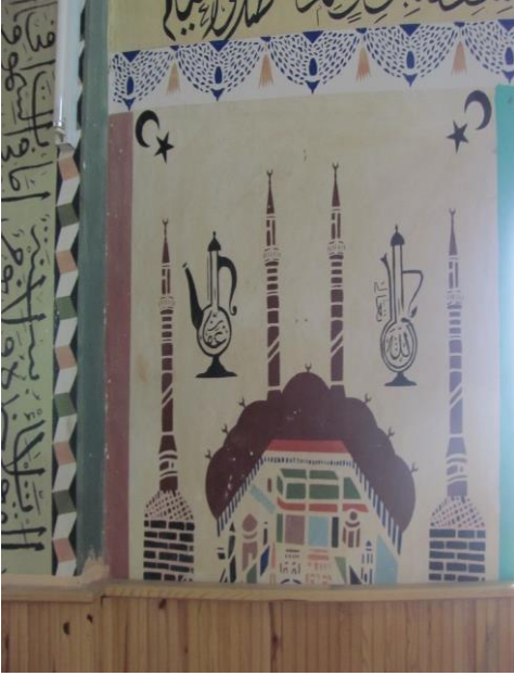
Fotoğraf 3. Cami duvarı yazılı ibrik motifleri, Burdur-Tefenni-Belkaya Köyü camii mihrap duvarı, sıva üstü kalem işi, (Soysaldı arşivi 2013).