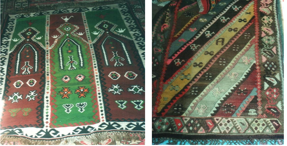
Fotoğraf 5. Kilim seccadeler, a) saf seccade, b) kilim yayğı, Erzurum, (Soysaldı arşivi).

Erzurum, Burdur, Antalya ve Kırşehir’de tespit edilen seccade kilim ve halı örnekleri yanında ulaşılamayan birçok yörenin halı ve kilim dokumalarında ibrik motifleri görülmektedir. Halı ve kilim seccade ve yaygılarda ibrik yangışları zeminde, mihrap tepeliğinde, mihrabın üst köşelerinde veya mihrap nişi içinde yer almaktadır.