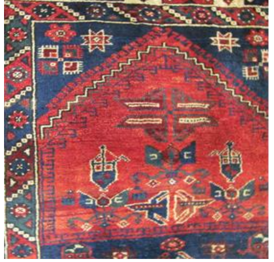
Fotoğraf 7. Halı seccade mihrap detayı, Özel koleksiyon, (Soysaldı arşivi, 2011).

Kırşehir-Mucur seccadesinde mihrap köşelerinde büyük yuvarlak hazneli simetrik duran, iki ibrik yer almaktadır. İbrik haznesi üç rozet çiçeği, kapak üzeri de tığlarla süslenmiş estetik kaygıyla tasarlanmış hissi uyandırmaktadır. Köşelerde tek başına olan bu vurgulu ibrik motifleri seccadenin bezeme karakterini oluşturmaktadır.