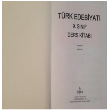
Şekil 3. Türk Edebiyatı 9. Sınıf Ders Kitabı İç Kapak

Kitabın S1 ile başlayan S17'ye kadar devam eden bölümünde ise Indiana eyaletinin, ortak çekirdek standartları kabul edilmeden evvel İngilizce Dil Sanatları (ELA) dersi için düzenlemiş olduğu standartlara yer verilmiştir.