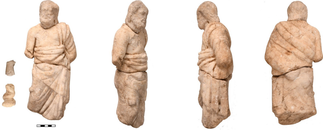
Fig. 3a-b. Bozukbağ Asklepios Heykelciği