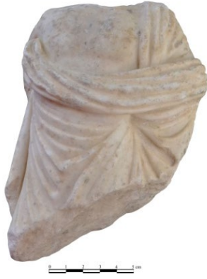
Fig. 8. Stratonikeia Asklepios Heykelciği Torsosu (Özgan 1999, 123-1234, Taf. 39c'den)

seviyesinin altında 'v' şeklinde doğrusal dikey kıvrımlarla tamamen kaplıdır. Tanrının bu görüntüsü, Mısır tanrısı Sarapis'in (Serapis'in) karakteristik özellikleriyle birleşmektedir. Nitekim Stratonikeia'nın kutsal alanı konumundaki Lagina'da Sarapis kültünün varlığı ve MS II. yüzyılda adına yapılmış bir naiskosun mevcut olduğu bilinmektedir 33 . Bu tipin ikonografik benzeri Atina Agorası kazılarında da gelmiştir 34 . Agora buluntusu küçük boyuttaki bu heykel, gymnasium buluntusu Stratonikeia örneğinde görüldüğü gibi tanrı Sarapis ile özdeşleştirilmiştir. Mevcut veriler Asklepios ile Sarapis arasında yakın bir ilişkinin olduğunu göstermektedir. Bu konuda yaşamının büyük bir kısmını Smyrna'da geçiren ve dönemin önde gelen hatiplerinden biri olan Aelius Aristides'in yazıları önemlidir. Aristides'in yazdıklarından onun Asklepios'tan sonra tedavi için en çok başvurduğu tanrı ve tanrıçanın Sarapis ve Isis olduğu anlaşılmaktadır. Bu da Smyrna'da kültü bulunan Sarapis'in de koruyucu bir sağlık tanrısı olarak önemini göstermektedir 35 . Benzer şekilde Kyme 36 buluntusu olan bronz tabula ansata ve üzerine eklenen bir çift kulak adağı, yazıtına göre bir kadın tarafından koruyucu tanrıça Isis'e ithaf edilmiştir. Bu bilgiler ışığında Stratonikeia gymnasium buluntusu Asklepios'un Mısır tanrısı Sarapisle özdeşleştirilmesi onun da koruyucu bir sağlık tanrısı olduğuna işaret etmektedir.