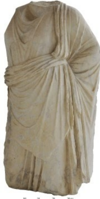
Fig. 9. Stratonikeia Asklepios-Sarapis Torsosu. (Özgan 1999, 124-125, Taf. 39d'den)

Stratonikeia buluntusu mezar stelleri arasında hekim mezarları da yer almaktadır. Bunlardan ilki Epaphroditos'un mezar steli dir 37 . Yazıtına göre kabartma şeklindeki erkek büstün Arkhiatros olduğu anlaşılmaktadır 38 . Mezar stelinin kaidesi üzerinde yine kabartma şeklindeki karşılıklı dövüşen horoz tasviri, sağlık tanrısı Asklepios'u işaret etmektedir. Hellas'ta horoz khitonik bir figürdür ve Asklepios'un kutsal hayvanları arasında geçer. Asklepios'a genelde horoz adanmıştır ve bu inanç günümüzde de devam eden bir uygulamadır 39 . Nitekim sağlıkla ilgili adakların genelde horoz olması rastlantısal değildir. Platon'un Sokrates'in ölü-