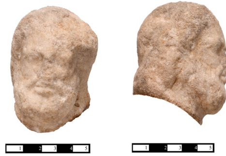
Fig. 5a-b. Asklepios Başının Cepheden ve Sağ Profilden Görünümü

Asklepios'un heykeltıraşlık eserleri, diğer tanrılarınkiyle karşılaştırıldığında tipolojik olarak dikkate değer ölçüde tek düzedir 9 . Her boyutta ve çeşitli pozlarda sayısız Asklepios heykeli vardır. Bunların çoğu sağlık tanrısının nitelikleriyle yakından ilişkili tiplerdir ve en önemli aksesuarı asaya dolanmış yilandır. G. E. van der Ploeg, LIMC'e göre antik döneme ait on yedi farklı türde Asklepios heykelinden bahseder 10 . Bu tipler çoğunlukla, tanrının genel bir Klasik temsilinin varyasyonları şeklindedir. Bu da onu Bozukbağ örneğinde olduğu gibi kolayca tanınabilir kılar. Bu çeşitlilik içinde en tanınmışları duruş pozisyonları ve hymation 'un ifade tarzına göre 11 Giustini 12 , Campana 13 , Velia 14 , Amelung 15 , Museo Nuovo 16 , Nea (Paphos-Alexandria-Trier) 17 , Anzio 18 , Doria 19 , Chiaramonti 20 ve