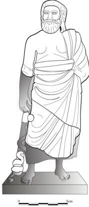
Fig. 4. Bozukbağ Asklepios Heykelciği Tamamlama Önerisi (Çiz. N. Durnagölü)

Bozukbağ Asklepios heykelciğinde arkada sol omuz üzerinden gelen kalın hymation kumaşı belde kalın tomar yaparak döndürülmeden düz bir şekilde sol kol altına sıkıştırılmıştır. Buradaki ağır kıvrımların arası matkap ile derin kanal şeklinde yapılmıştır. Ayrıca bacak arası ve hymation 'un sol kol altından düşen kalın kıvrımlarında yine matkap kullanılmıştır. Sağ bacağın hareketi sonucunda bacak üzerindeki giysi kıvrımları gerilerek bacağın varlığını ortaya çıkarmıştır. İki bacak arasında, sağ alt baktan başlayarak sol üst bacağı doğru yükselen diagonal kıvrımlar bulunmaktadır. Arkadan hymation 'un kenar kıvrım rulosu sol omuz üzerinden sol kolu arkadan ve önden tamamen örterek öne atılmıştır. Hymation 'un geniş ve kalın bir kıvrımı sol kolun altından dikey bir şekilde korunan yere kadar indirilmiştir.