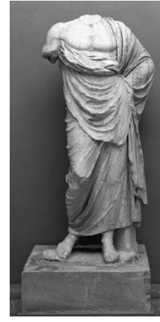
Fig. 7. Eleusis Arkeoloji Müzesi (MÖ IV. yüzyıl sonları)

Çalışmanın konusunu oluşturan Bozukbağ Asklepios heykelciği yaygın bir tiptir ve ikonografik benzerlerine göre “ Eleusis ” tipinin yerel bir versiyonuna aittir. Bu tipe adını veren Asklepios heykeli 22 Eleusis Müzesi’nde sergilenmektedir (Fig. 7). Bu tip görsel olarak MÖ 330’lardan beri bilinmektedir ve bu nedenle o dönemde yapılmaya başlanmış olmalıdır. Yaklaşık yirmi beş örnek sayesinde bilinen bu tip, Asklepios Giustini tipinden yani Atina Asklepieionun’daki Asklepios’un klasik temsilinden esinlenmiştir 23 . İki tip arasındaki fark ise hymation ’un örtülmesinden kaynaklanmaktadır. Giustini tipinde hymation ’un yapısında sol dirsek üzerinden atılan giysi kıvrımı izleyici tarafından görülür. Eleusis tipinde ise dirsek hizasından gelen giysi kıvrımı sol kol altına sıkıştırılmıştır. Eleusis tipinde hymation vücudu daha sıkı sarar ve vücut daha kıvrımlıdır. Ancak her iki tipte de hymation sol dirseği sarmaktadır.