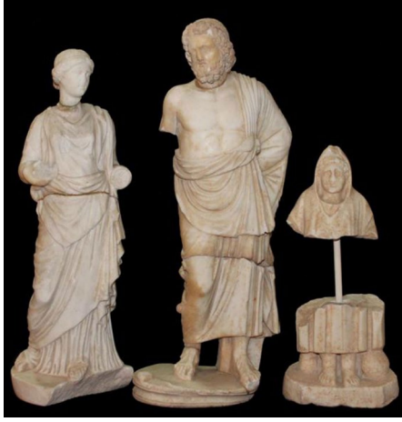
Fig. 6a. Bolu Arkeoloji Müzesi (Sezer 2014, res. 1'den)

Eleusis 21 gibi farklı tiplere ayrılmıştır (Figs. 6a-b, 7).