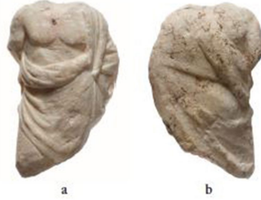
Fig. 6b. Atina Agorası (Martens 2018, fig. 15a-b'den)