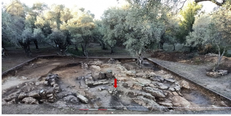
Fig. 1. 20BZS02 Numaralı Sondaj Alanının Genel Görünümü

Muğla ili, Yatağan ilçesi, Yeşilbağcılar mahallesi sınırları içindeki Bozukbağ mevkinde 1 , 1969 yılında Prof. Dr. Yusuf Boysal başkanlığında kazıların yapıldığı, Geç Geometrik, Geç Klasik ve Roma dönemlerine ait mezarların bulunduğu alanın çevresinde, 2020 yılında Muğla Müze Müdürlüğü başkanlığında yapılan çalışmalarda temel seviyesinde tam planı mevcut olmayan bir yapı kalıntısı açığa çıkartılmıştır (Figs. 1-2). Bu yapı kalıntısının, eğime bağlı olarak iyi korunmuş olan köşesine yakın bir konumda ve taban üstü seviyede, sikke, kandil, anatomik sunu objeleri, farklı formlara ait çanak-çömlek parçaları, figürin parçası, tıp ve kozmetik buluntulardan oluşan eserlerle birlikte bir Asklepios heykelciği ele geçirilmiştir (Figs. 3-4). Söz konusu eserlerin tümü şu an Muğla Müzesi'nde bulunmaktadır.