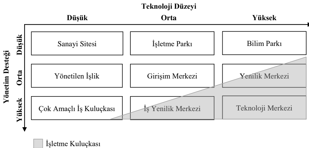
Şekil 2. Avrupa Komisyonu İşletme Kuluçkası Sınıflandırması

Avrupa Komisyonu tarafından yapılan bir sınıflandırma; bu tür farklı uygulamaların teknoloji düzeyi ve yönetim desteğine göre sınıflandırmasını yapmaktadır. Buna göre; hem teknoloji düzeyinin düşük olduğu hem de yönetim desteğinin düşük olduğu organizasyon biçimi "Sanayi Sitesi" (Industrial Estate) olarak adlandırılmaktadır. Dikey eksen boyunca aşağı doğru gidildikçe yönetim desteği artmaktadır ve dikey eksenin en altında "Çok Amaçlı İşletme Kuluçkası" yer almaktadır. Yatay ekseninde sağa doğru gidildikçe ise teknoloji düzeyi artmaktadır. Buna göre; "İşletme Parkı" teknoloji düzeyinin orta düzeyde olduğu ancak yönetim desteğinin düşük düzeyde kaldığı bir organizasyon biçimi iken, "Bilim Parkı" ise teknoloji düzeyinin yüksek ancak yönetim desteğinin düşük olduğu bir organizasyon biçimidir. Şeklin sağ alt köşesine doğru gidildikçe "İşletme Yenilik Merkezleri", "Yenilik Merkezleri" ve "Teknoloji Merkezleri" uygulamaları her iki alanda da orta ve yüksek düzeyde destek sağlayan uygulamalar olarak görülmektedir. Söz konusu üç uygulama ise Avrupa Komisyonu tanımlamasına göre tek bir ortak kavram altında "İşletme Kuluçkası" olarak tanımlanmaktadır (EC-EDG, 2002: 6).