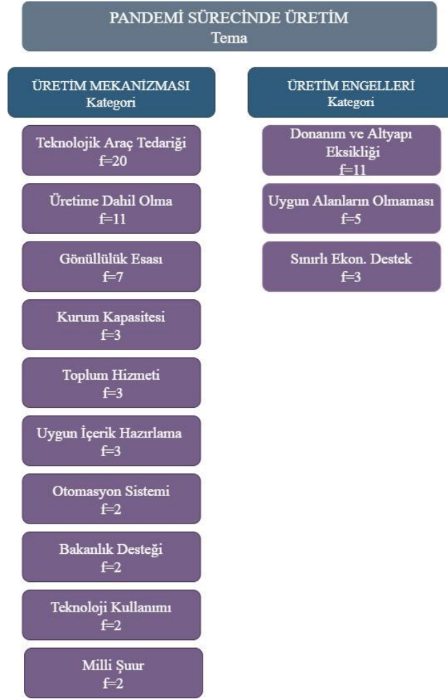
Şekil 2. Pandemi Sürecinde Üretim Temasına İlişkin Bulgular