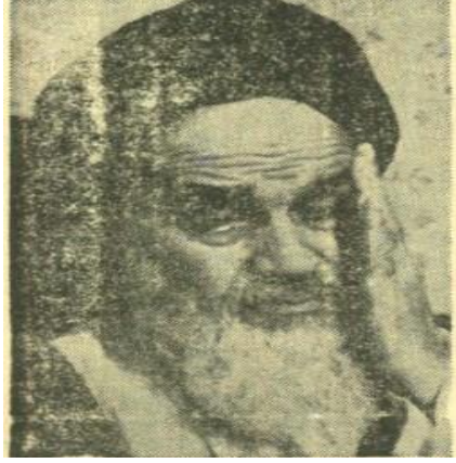
Fotoğraf 1: Yeniden Milli Mücadele Dergisi'nde Ayetullah Humeyni'nin Sıklıkla Kullanılan Fotoğrafı (Yeniden Milli Mücadele Dergisi- 25 Aralık 1979 Tarihli Sayı)

Yeniden Milli Mücadele'de dönemin İran iç siyasetinin ana aktörlerinin Ayetullah Humeyni, Muhammed Rıza Şah, Mehdi Bazergan ve Ebulhasan Beni Sadr olarak konumlandırıldıkları tespit edilmiştir. Mehdi Bazergan'ın dönemin başkanı olması, Beni Sadr'ın ise Cumhurbaşkanı olması metinlerde yer verilmelerine ve sürecin aktörleri olarak konumlandırılmalarına zemin hazırlarken metinlerin büyük bir çoğunluğunda Muhammed Rıza Şah'ın yer verilmesi dikkat çekicidir. Zira içerik analizine dâhil edilen metinlerin yalnızca %7'si devrimden önceki sürecin iç siyasetini ele almaktadır. Dolayısıyla arda kalan diğer tüm metinler Şahlık rejiminin fiilen söz konusu olmadığı bir sürecin siyasi gelişmelerinin yer verildiği metinlerdir. Devrim Konseyi Geçici Hükümeti sürecinden önce Şah'ın İran'dan ayrılmış olması ve ülkede yeni bir siyasal sistemin kurulmasına rağmen birçok metinde sürecin ana aktörü olarak yer verilmesi üzerinde durulması gereken bir husustur. Sürecin dinsel, siyasal ve toplumsal düzeyde lideri olarak Ayetullah Humeyni'nin kabul görmesine rağmen Yeniden Milli Mücadele dergisinde Şah'a bu kadar sıklıkla yer verilmesi derginin İran iç siyasetinin taraflarına yönelik tutumu konusunda önemli ipuçları sunmaktadır.