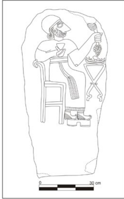
Figür 3. Yörükselim Mezar Stelinin Çizimi.

volüt şeklinde gösterilmiş olup sakal ise ince çizgilerle verilmiştir. Sakal bu yönüyle Maraş Bölgesinde bulunan diğer mezar stelleri örneklerinde gördüğümüz ve Arami tarzında betimlenmiş spiral bukleler formunda ki sakaldan farklılık gösterir.