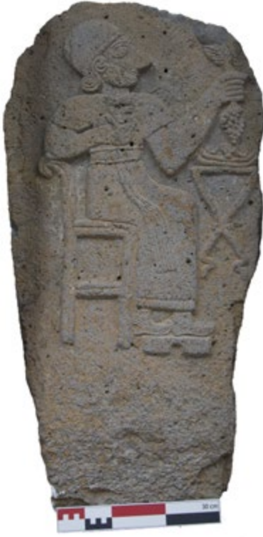
Figür 2. Kabramanmaraş Müzesi'nde bulunan Yörükselim Mezar Steli.