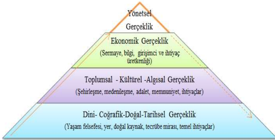
Şekil 3. Yönetsel gerçekliğin devinimsel inşası

belirleyici ve baskın değişkenlerin etkili olduğu bir mekanizma ile mi açıklanabileceği daha önce farklı yaklaşımlarla ifade edilmişti. Buna göre, ekonomik determinizm aşırı indirgemeci olduğundan dolayı çok faktörlü bir sürecin mevcut olduğunu ifade etmek olanaklıdır. Kültür, din ve tarihsel gerçekliklerin de ekonomik ilişkilere bağlanması bazı toplumlar için geçerli olabilse de her zaman geçerli olabilecek bir genel kabul görmesi olanaklı görülmemektedir. Yönetsel gerçekliğin oluşum sürecinde etkili olabilen faktörlerin neler olabildiği ve toplumların tarihsel gelişimi ve mevcut realiteler göz önünde bulundurularak aşağıdaki şekilde bir model ortaya konulması olanaklıdır. Bu modelin farkı alt yapı ve üst yapı öğelerini sadece ekonomik ve yönetsel gerçeklikler, alt yapı- üst yapı şeklinde basite indirgmeden bunların temelinde var olan toplumsal, kültürel algısal, dini, coğrafik, doğal ve tarihsel gerçekliklerin de dikkate alınmasında yatmaktadır.