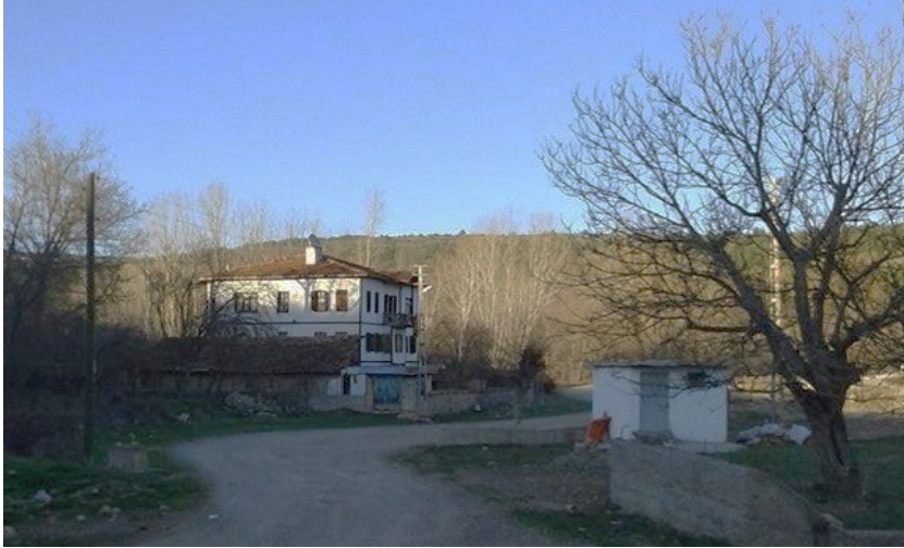
Şekil 5. Değirmencik köyü yapılarından bir görünüm