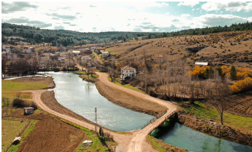
Şekil 2. Değirmencik köyü ve Eflani deresi (Safranbolu Belediyesi, 2019)

Köy, Eflani deresinin kıyısında kurulmuştur. Eflani deresi, bölgede bulunan tek ve önemli yer üstü su kaynağıdır. Mikroklimatik etkisi ile dere kıyısında yazları daha serin, kışları saha soğuk olmaktadır. Biyoçeşitlilik bakımından zengin olan dere ekosistemi halen canlıdır (Şekil 2). 2021 yılında dereye su samurlarının bulunduğu tespit edilmiştir (Bostancı 2021). Bölgede yaygın olarak görülen ağaç türleri; karaçam ( Pinus nigra ), meşe ( Quercus sp. ), ardıç ( Juniperus sp. ) ve kavaktır ( Populus sp. ).