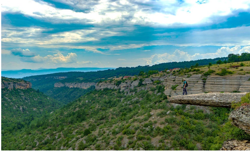
Şekil 3. Sırçalı kanyonu (Wikiloc, 2022)

Sırçalı Kanyonu ve Taş Teras (Şekil 3) köyün yakın çevresinde yer alan ve turizm alanı olarak değer gören önemli doğal alanlardır.