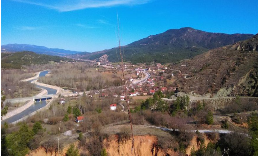
Şekil 4. Değirmencik köyü genel görünümü

malzeme depolama alanları bulunmakta üst katları ise asıl yaşam alanlarını oluşturmaktadır. Evler bahçe duvarlarıyla çevrilmiş durumdadır. Köyün yakınında geniş orman alanı yer almaktadır.