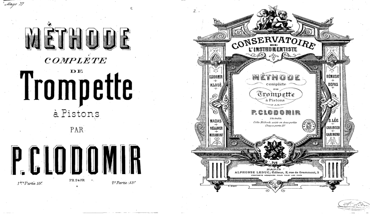
Clodimir, Methode Complete de Trompette