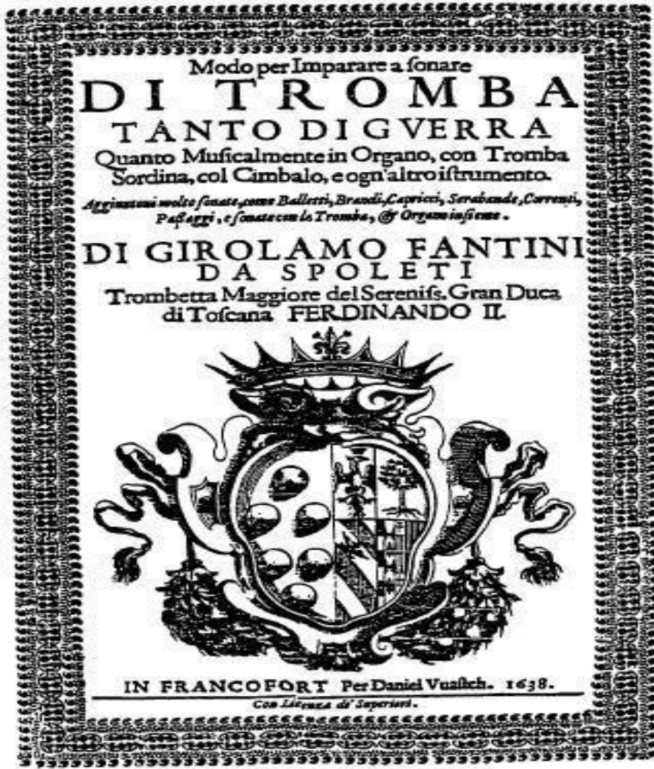
Şekil 2. Girolamo Fantini Trompet Metodunun Orijinal Kapağı

https://www.historicbrass.org/edocman/hbj-1994/HBSJ_1994_JL01_004_Conforzi.pdf (Erişim Tarihi 15.08.2020).