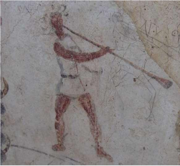
Şekil 1. Eski Çağlarda Trompet

Geçmiş milattan önce 1500' lü yıllara kadar dayanan trompetin, deniz kabukları ve hayvan boynuzlarından üretilmesi ile başlayan serüveni günümüze gelindiğinde bakır alaşımli son halini alması ile tamamlanmıştır (Sabır, 2012: 56). Orta Asya Türk toplumlarında da trompetin ilkel hali olan düz borunun kullanımına rastlanılmaktadır. Boru sisteminin Türk toplumlarında askeri ve sosyal anlamda kullanmaları ile ilgili bulguya 8. yüzyılda Orhun yazıtlarında rastlanılır. Orta Asya'dan Avrupa ve Afrika topraklarına kadar uzanan Türk toplumları trompetin gelişmesi ve yayılmasında önemli rol oynamıştır (Üstün, 2020: 26).