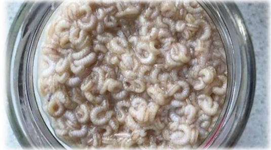
Şekil 1. Apilarnilin ham görünümü (Anonim 2021)

Apilarnil örnekleri apilarnilin en yoğun olduğu Nisan, Mayıs ve Haziran aylarında yani kolonilerin oğul verme hazırlığı, polen ve nektar akımının fazla olduğu bu aylarda apilarnil toplanmıştır. Apilarnilde hasat işlemi haploid erkek arı larvasının sahip olduğu besin bileşenleri pupa dönemine geçtiğinde değişeceğinden 3-7 günlük larval yaşta iken yapılmıştır. Hasat edilen apilarnilin soğuk zincir muhafazası sağlanmıştır. Toplanan apilarnil önce dondurulmuş, daha sonra besindeki su buz haline getirilmiştir ve Liyofilize işlemi uygulanmıştır. Hasat edilen apilarnil gerekli etiketlemeler yapıp kimyasal analizler aşamasına kadar -80 °C dondurucuda muhafaza edilmiştir.