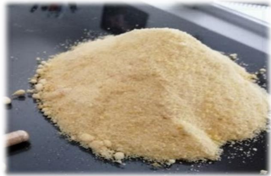
Şekil 2. Apilarnilin liyofilize edilmiş görünümü (Anonim 2021)