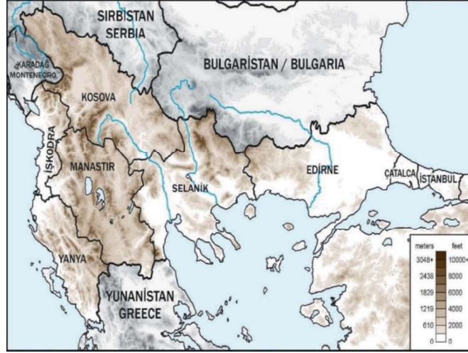
Ek 1: 19. Yüzyıl Sonlarında Rumeli Haritası 2