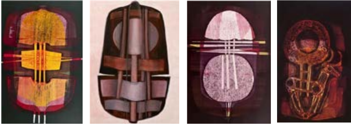
Resim 6,7,8,9: Güneş Kursları Serisi

Sanatçının Hatti ya da Hitit kültüründen etkilenererek içselleştirdiği güneş kursları ve figürler bağlamından koparılarak yani dinsel özelliklerinden sıyrılarak onları yeni bir sanat nesnesine dönüştür. Sanatçı;