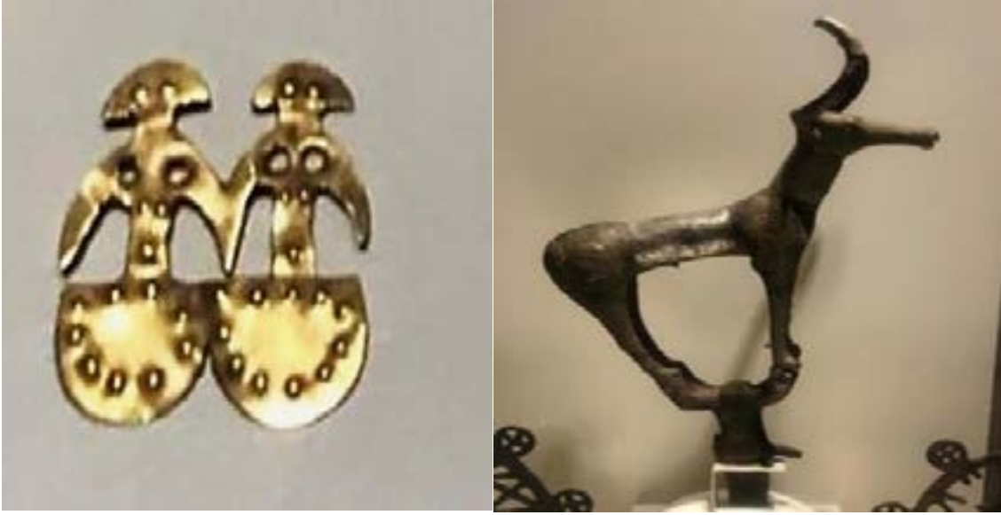
Resim 1. İkiz İdol

(Özge Yılmaz Fotoğraf Çekimi, Anadolu Medeniyetleri Müzesi)