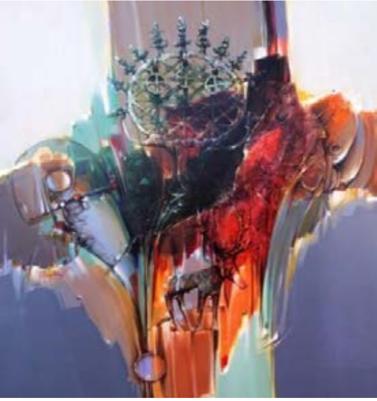
Resim 22: Geçmişin İzinde (Bellek Anadolu Sergi Katalogları, sayfa 65, 2022)