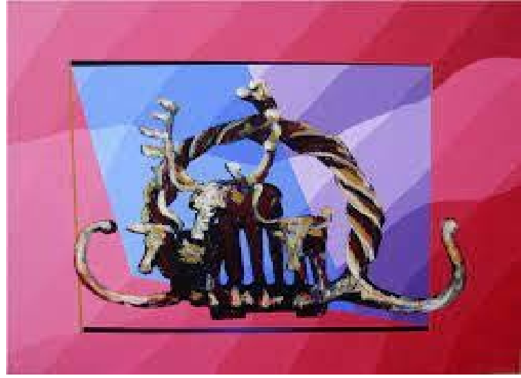
Resim 23,24,25. Anadolu Uygarlıkları Çeşitlemeleri Serisi