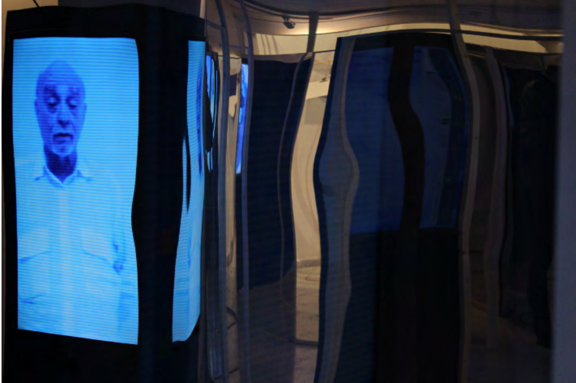
Şekil 1. Demokrasinin Aynalı Sarayı'nın içinden bir fotoğraf

DAS, “halk” adına konuşan ve ideolojilerin “halk” üzerindeki talebini temsil eden beş ideolojik sesi bir araya getirerek, bu oyuna temsil ve katılımı birlikte bir boyut katmaktadır (transkripsiyonlar için bkz. Carpentier, 2019, s. 153). Her bir ses – neredeyse insan boyutunda bir televizyon ekranına yansıtılan bir aktör tarafından temsil edilen – “Ben halkım” cümlesinin tekrarıyla açık bir şekilde “halk” adına konuşur. Bu sesler, ziyaretçileri dayanışmacı, liberal, militarist, otoriter ve milliyetçi sesleriyle özdeşleşmeye davet eder, ancak saray aynı zamanda ziyaretçileri maddi olarak bu seslerin içine gömmekte (ve tuzağa düşürmekte)dir.