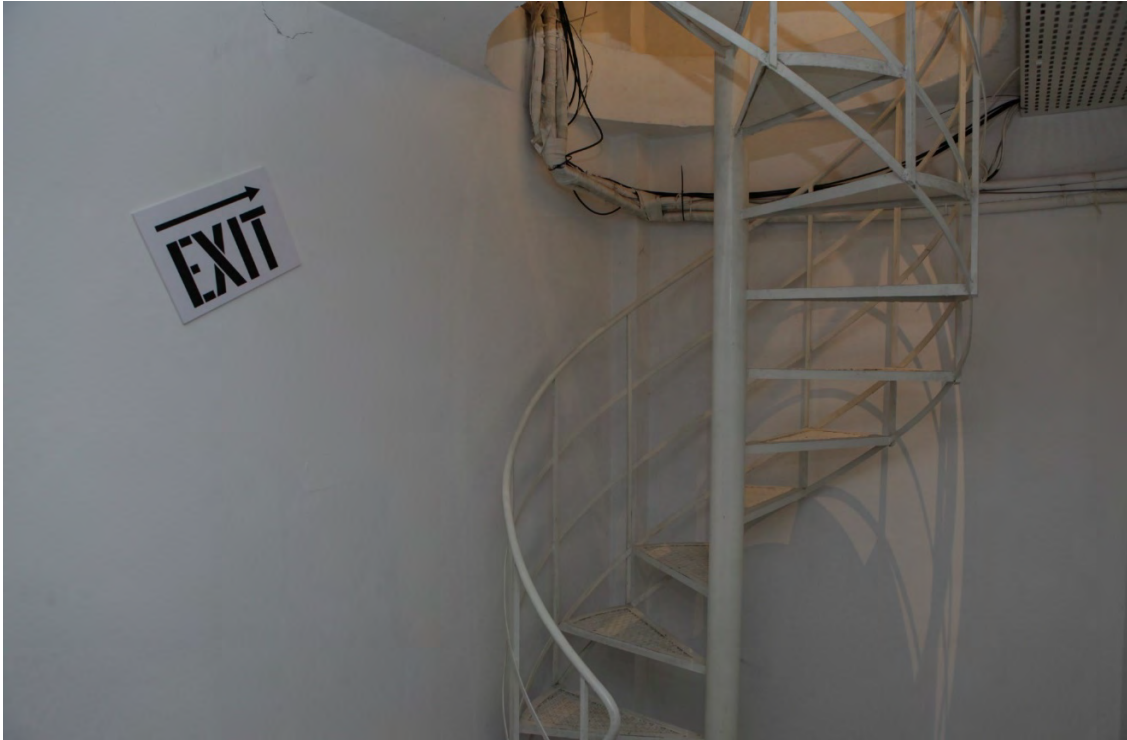
Şekil 4. Çıkış merdivenleri.

Ancak DAS 'ın maddi yapısından çıkan en önemli (ve çözülemez) soru, demokrasinin sınırlarıyla ilgili soruydu. Kare şeklindeki DAS 'ın kendi duvarları ve galerinin duvarlarıyla oluşan bir dış kısmının olması kaçınılmazdı. Ayrıca bir girişi ve çıkışı olması gerekiyordu. Aynalı sarayın fiziksel yapısı sadece bu dış kısım ile ilgili teorik soruyu değil, aynı zamanda çıkışın (teorik olarak) ne anlama geldiği sorusunu da doğurdu. Enstalasyon, galerinin bodrum katında yapıldı ve (yukarı doğru) girdap metaforuna referansla çıkış olarak küçük bir döner merdiven kullanılmasına imkan verdi (bkz. Şekil 4). Daha da ilginç olan, serginin bitiminin ardından enstalasyonun yıkılmasını içeren son aşamaydı. Bu aşama demokrasinin kolayca sona erebileceğini ve gerçekleşirse/gerçekleştiğinde bunun (büyük olasılıkla) vatandaşlarının elinde olacağını acımasız bir hatırlatıcısı işlevi gördü.