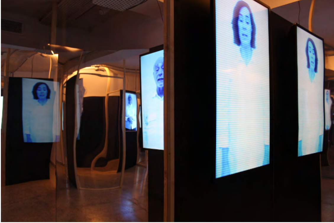
Şekil 2. Demokrasinin Aynalı Sarayı'nın içinden bir fotoğraf