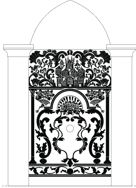
Şek. 1- Çeşmenin çizimi.

Dikey dikdörtgen formulu ayna taşı üzerindeki iki sıra şerit, çeşmeye üç panoya ayrılmış izlenimi kazandırmıştır. Bu bölümlenmede üst ve alt panolar yatay dikdörtgen şekilliysen, ortadaki pano yaklaşık kare formudur. Her pano, dönemin moda motiflerinin kullanıldığı oldukça hareketli kompozisyonlarla bezenmiştir.