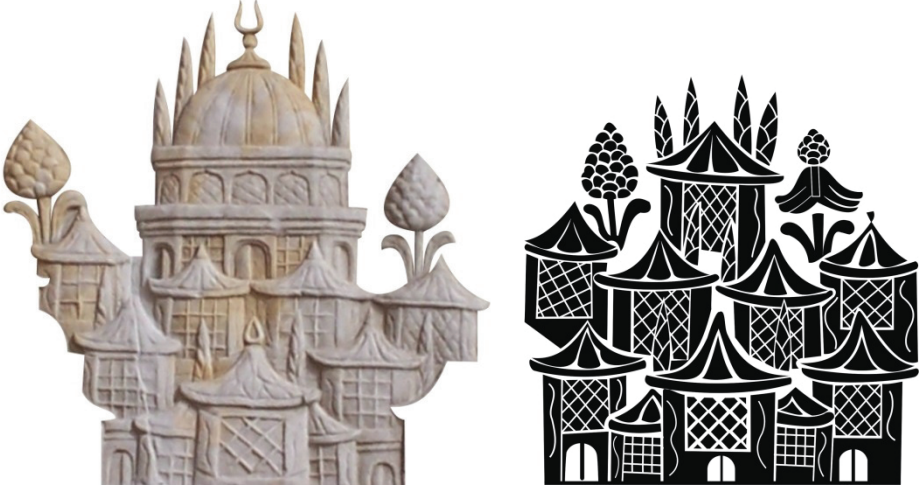
Res. 9, Şek. 2- Mimari betimleme detayları.