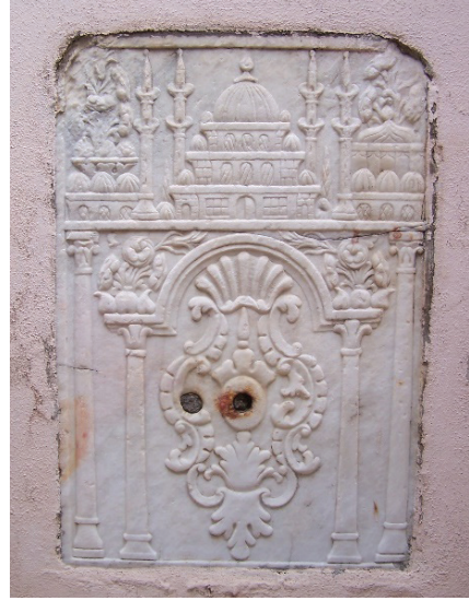
Res. 5- Şadırvanaltı Camisi Çeşmesi