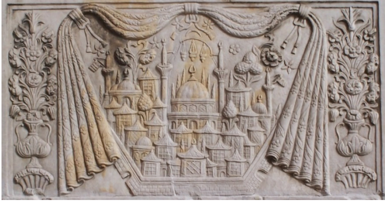
Res. 8- Çakaloğlu Hanı Çeşmesi'nin mimari tasvirli panosu.