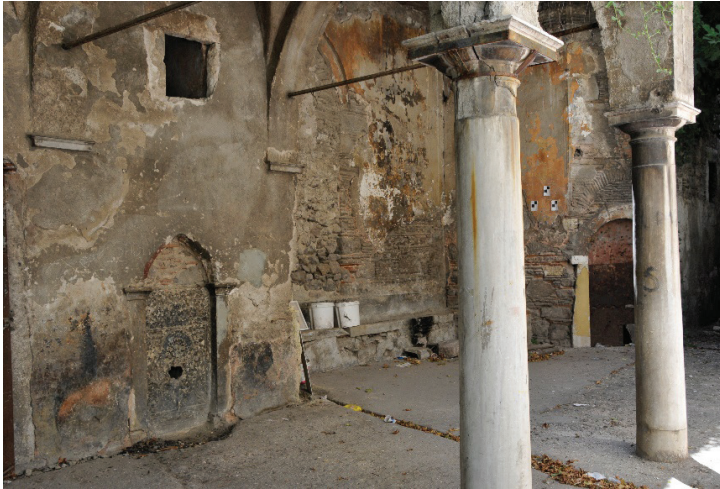
Res. 2- Çeşmenin genel görünümü.

Çeşme, kilisenin müştemilat mekânının duvarı üzerindedir (Res. 2). Tek cepheli çeşme iki yandan plasterlerle sınırlandırılmış sivri kemerli bir niş içerisinde (Res. 3). Sivri kemerli alınlık içinde olması beklenen parça günümüze gelememiştir. Çeşmenin teknesi ise zemin kotunun zaman içerisinde yükseltilmesi nedeniyle bugün görülememektedir. Ayna taşı yekpare mermer olup, üzerindeki bezemelerin bir kısmı aşınmış, lüle deliğinin bulunduğu yer de tahrip olmuştur. Arazi çalışması sırasında çeşmenin stampajı alınmış, ofis çalışmaları sırasında ise fotoğraflar yardımıyla çeşmenin süslemelerine ait çizimler yapılmıştır (Şek.1).