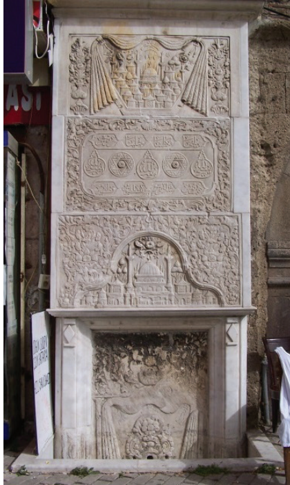
Res. 6- Çakaloğlu Hanı Çeşmesi