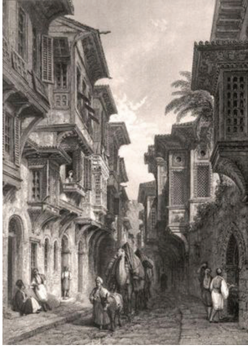
Res. 10- Thomas Allom'un 1839 tarihli İzmir gravürü.