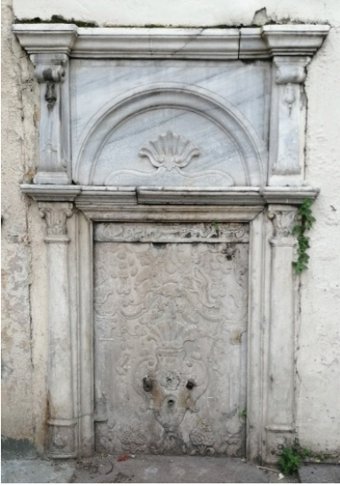
Res. 4- Kemeraltı Camisi Çeşmesi