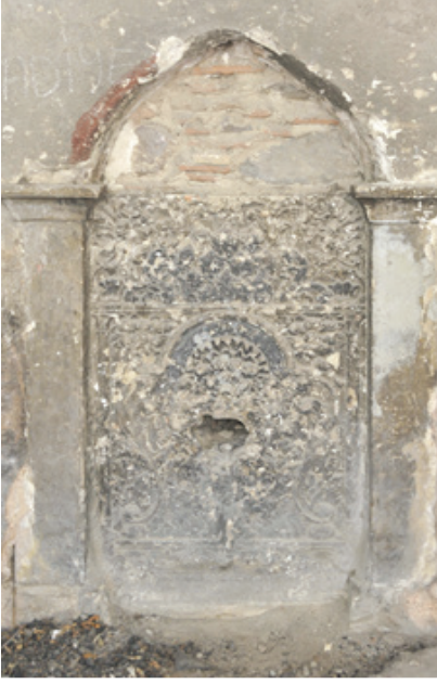
Res. 3- Genel görünüş.