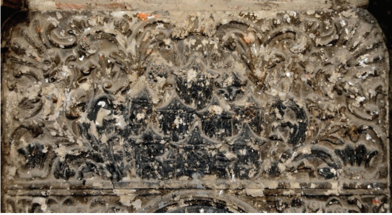
Res. 7- Agios Ioannis Teologos Kilisesi Çeşmesi'nin mimari tasvirli panosu.

da 29 , henüz kesin olarak cevaplanabilmiş değildir. Bu çalışma kapsamında da bu soruların cevabı belirsizdir. Fakat Thomas Allom tarafından İzmir’deki bir sokağın betimlendiği 1839 tarihli gravür 30 dikkatle incelenirse (Res. 10), mermer panodaki tasvir ile gravürdeki betimleme arasında şu benzerlikler kurulabilir: Dar bir sokakta karşılıklı betimlenen Türk evlerinin yuvarlak kemerli giriş açıklıkları, kafesli pencereleri ve sokağın perspektifi içerisinde alçalıp yükselen evler. Bu betimlemenin 19. yüzyıl İzmir kentindeki bir sokağı yansıttığını söylemek de mümkündür.