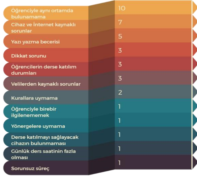
Şekil 5: Uzaktan eğitimdeki sorunlara ilişkin oluşturulan kodların dağılımı

Uzaktan eğitimdeki sorunlar ile ilgili öğretmenlerin bazı ifadelerine yer verilmiştir. Bu ifadeler şöyledir: