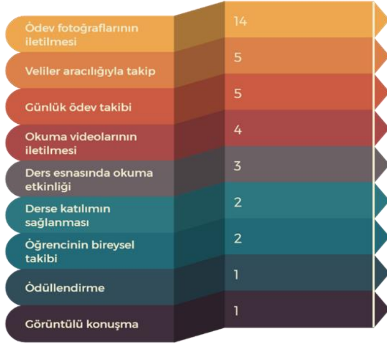
Şekil 4: Öğrenci gelişiminin takibine ilişkin oluşturulan kodların dağılımı

Öğrenci gelişiminin takibi ile ilgili öğretmenlerin bazı ifadelerine yer verilmiştir. Bu ifadeler şöyledir: “Derse ve etkinliklere katılımlarını bireysel olarak takip ettim. Ayrıca okuma çalışmalarının takibini telefonla görüntülü olarak yaptım. Ödevlerinin kontrolünü veliler aracılığıyla yaptık.” (Ö4, E, 23 Yıl) “Öğrencilere ödev verdikten sonra ödevlerini Whatsaptan atmalarını istiyordum. Whatsapp grubumuz vardı zaten uzaktan eğitimde Whatsapp’ı çok sık ve mecburen kullandık. Veliler ödevleri oradan gönderdiler, ben de kontrol ve takibini gerçekleştirdim. Ödevlerini kontrol ederken tespit ettiğim yanlış ve hataları uzaktan eğitimle gerçekleştirdiğimiz derslerde telafi ettik.” (Ö13, E, 28 Yıl)