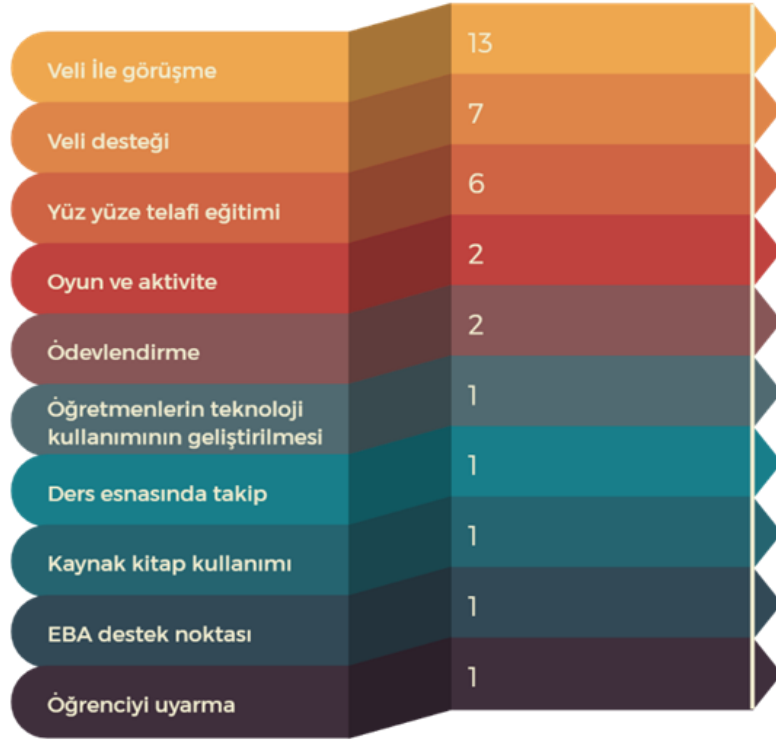
Şekil 6: Uzaktan eğitimdeki sorunların çözümüne ilişkin oluşturulan kodların dağılımı

Sorunların çözümü ile ilgili öğretmenlerin bazı ifadelerine yer verilmiştir. Bu ifadeler şöyledir: