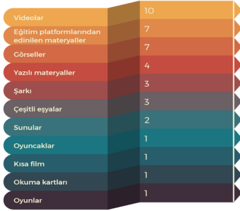
Şekil 3: Kullanılan materyallere ilişkin oluşturulan kodların dağılımı

Kullanılan materyallerle ilgili öğretmenlerin bazı ifadelerine yer verilmiştir. Bu ifadeler şöyledir: