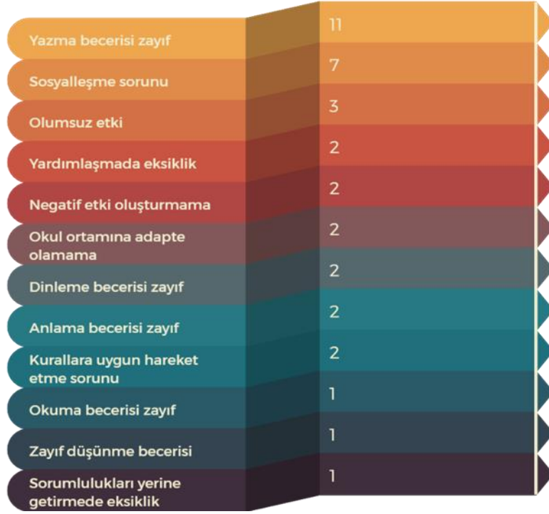
Şekil 8: Uzaktan eğitimin öğrencilere etkisine ilişkin oluşturulan kodların dağılımı

Uzaktan eğitimin öğrencilere etkisi ile ilgili öğretmenlerin bazı ifadelerine yer verilmiştir. Bu ifadeler şöyledir: “Okuma ve yazmayı yüz yüze öğrenen öğrencilerle uzaktan öğrenen öğrenciler arasında farklar olacağını düşünüyorum. Uzaktan öğrenen öğrencilerin okuma ve yazma becerilerinin daha zayıf olacağı görüşündeyim.” (Ö5, E, 19 Yıl)