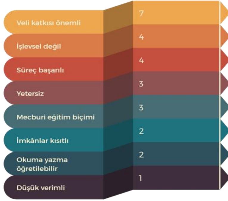
Şekil 7: Uzaktan eğitimin işlevselliğine ilişkin oluşturulan kodların dağılımı

Uzaktan eğitimin işlevselliği ile ilgili öğretmenlerin bazı ifadelerine yer verilmiştir. Bu ifadeler şöyledir: