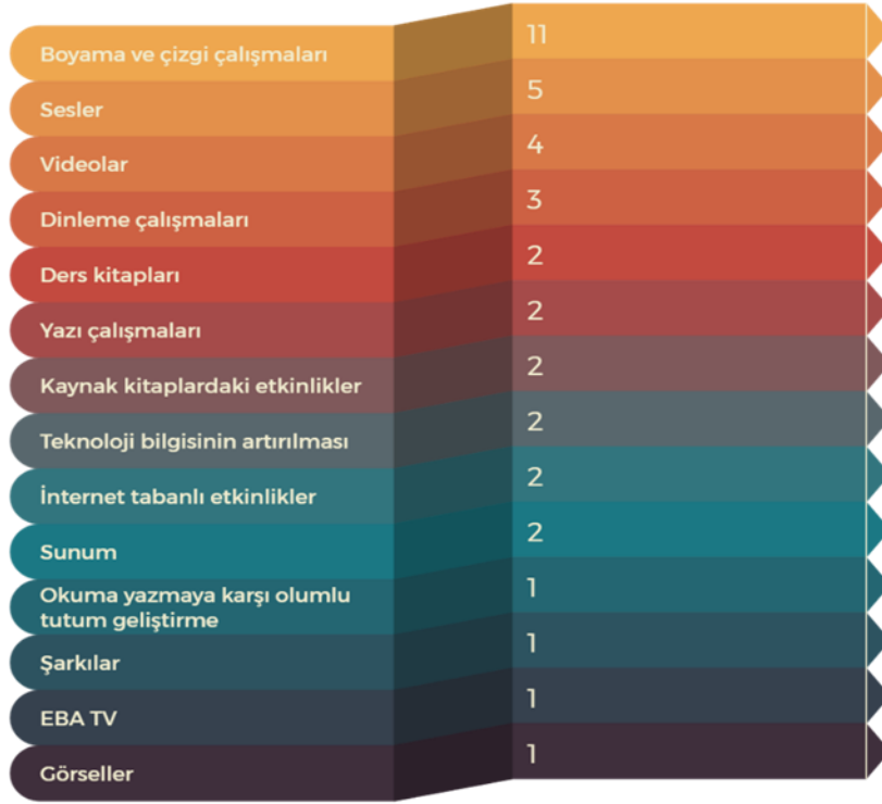
Şekil 2: İlk okuma yazmaya hazırlık sürecinde yazmaya hazırlık etkinliklerine ilişkin oluşturulan kodların dağılımı

İlk okuma yazmaya hazırlık ile ilgili öğretmenlerin bazı ifadelerine yer verilmiştir. Bu ifadeler şöyledir: