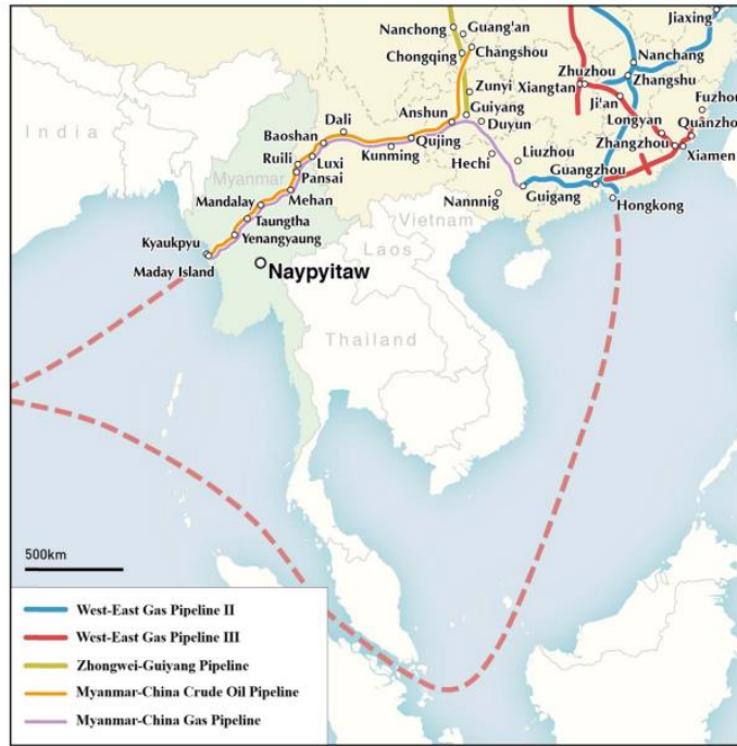
Resim 1. Çin-Myanmar Enerji Boru Hattı

Çin yönetimi, Ortadoğu ve Afrika'dan yapmış olduğu enerji ithalatını güven altına alabilmek için Myanmar'ın Sittwe ve Kyaukpyu Limanlarını enerji yatırımlarının odak noktası olarak belirlemiştir (Ateş, 2017:184). Myanmar'ın batı sahillerinden Bengal Körfezi'ne açılan Sittwe Limanı, Çin enerji ithalatında Malakka Boğazı'na alternatif oluşturan ve mevcut enerji güzergâhını büyük oranda kısaltan stratejik bir konuma sahiptir. Bu sebeple Çin, 2004 yılında Myanmar yönetimi ile görüşmelere başlamış, 2005 ve 2009 yıllarında Myanmar'dan Çin'e enerji ithalinin sağlanmasına yönelik anlaşmalar imzalanmıştır (Garlick, 2018:527). Bu anlaşmalar sonrasında Çin'in Myanmar'da hayata geçirdiği en önemli enerji projelerinden bir tanesi, Ortadoğu'dan Çin'in Guangzhou eyaletine gelen ithal petrol güzergâhını 1820 deniz mili kısaltan Sittwe-Kunming petrol boru hattının inşasıdır. Resmî olarak 2013 yılında hayata geçen boru hattı ile hem Çin'in enerji ulaştırma hatlarını kısaltarak enerji güvenliğini sağlaması, hem de Myanmar hükümetinin yüksek miktarda gelir elde etmesi hedeflenmiştir (Fiori & Passeri, 2015:690).