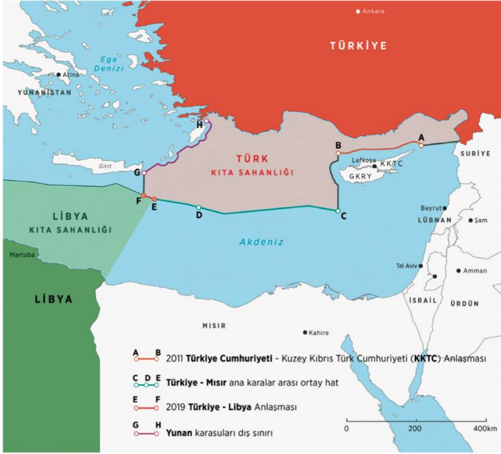
Şekil 2: Türkiye – Libya UMH Sınırlandırma Antlaşması Haritası