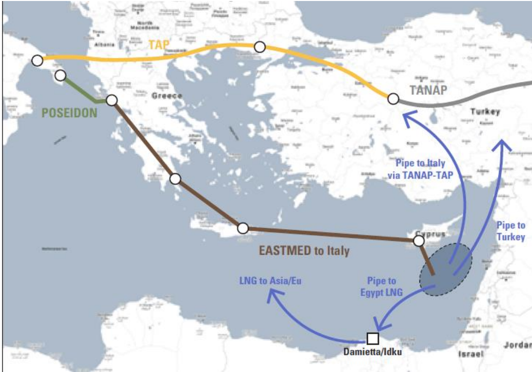
Şekil 3: İsrail’den Çıkacak Kaynağın Muhtemel Pazar Yolları ve TANAP Önermesi