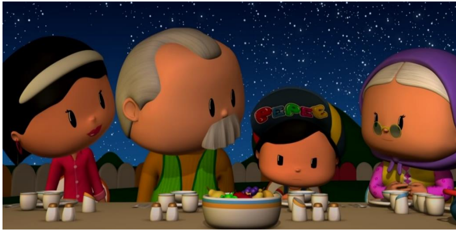
Şekil 1: Pepee 2. Bölüm Kalbim Kırıldı

Pepee, 2008 yılında TRT Çocuk 'ta yayınlanmaya başlamıştır. Başkarakter olan Pepee, 4 yaşında bir erkek çocuktur. Arkadaşlarına önem veren, ailesini seven, mutlu, saygılı, anlayışlı ve sevecen bir çocuk olarak seyirci karşısına çıkmıştır. Çizgi film içerisinde yer alan diğer karakterler ise; Pepee'nin annesi, babası, kız kardeşi, nenesi, Şıla, Eke, Zulu, Köpüş ve dış ses Şuşu'dur. Çizgi filmde, Pepee'nin diğer karakterlerle gündelik yaşamı konu alınmıştır, yerel dil ve Türk kültürüne ait öğeler kullanılmıştır.