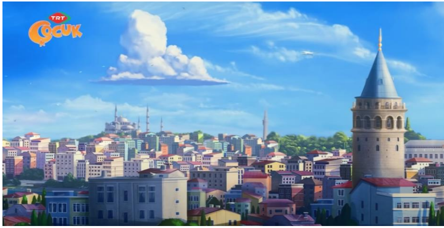
Şekil 4: Rafadan Tayfa 51. Bölüm Salça Zamanı

Niloya çizgi filminde yer alan karakterler, Tospik, Mete, annesi, babası, Murat, ve babaannesidir. Niloya ve ailesinin yaşamış olduğu kasabada gerçekleşen olaylar konu edilmiştir. Bölümde Niloya abisi Murat ve babası teknede Karadeniz'delerdir, Niloya ve abisi dedelerinin vermiş olduğu Karadeniz hazine haritasından hazineye ulaşmak isterler. Dedesinin vermiş olduğu haritada hazine olarak kastedilen aslında Karadeniz'in doğal güzelliği olmuştur. Bölümde Türk kültürüne ait öğeler olan şekil 3'de yer alan Niloya çizgi filminin giriş animasyonunda karakterler bir sofrada birlikte oturmakta ve kıyafet noktasında diğer incelenmiş olan çizgi filmler gibi yelek, yazma tercih edilmiştir. Teknede giderken arkalarında bulunan tekneye asılı Türk bayrağı olmuştur.