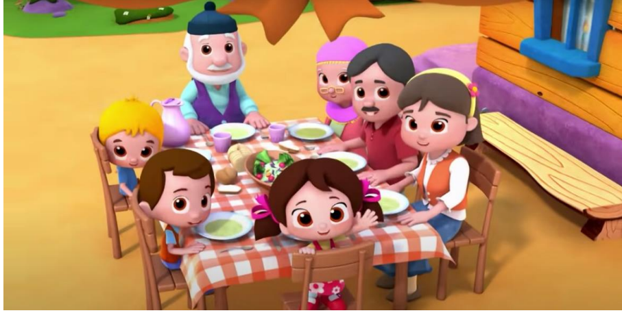
Şekil 3: Niloya Karadeniz Hazinesi

Niloya çizgi filminde yer alan karakterler, Tospik, Mete, annesi, babası, Murat, ve babaannesidir. Niloya ve ailesinin yaşamış olduğu kasabada gerçekleşen olaylar konu edilmiştir. Bölümde Niloya abisi Murat ve babası teknede Karadeniz'delerdir, Niloya ve abisi dedelerinin vermiş olduğu Karadeniz hazine haritasından hazineye ulaşmak isterler. Dedesinin vermiş olduğu haritada hazine olarak kastedilen aslında Karadeniz'in doğal güzelliği olmuştur. Bölümde Türk kültürüne ait öğeler olan şekil 3'de yer alan Niloya çizgi filminin giriş animasyonunda karakterler bir sofrada birlikte oturmakta ve kıyafet noktasında diğer incelenmiş olan çizgi filmler gibi yelek, yazma tercih edilmiştir. Teknede giderken arkalarında bulunan tekneye asılı Türk bayrağı olmuştur.