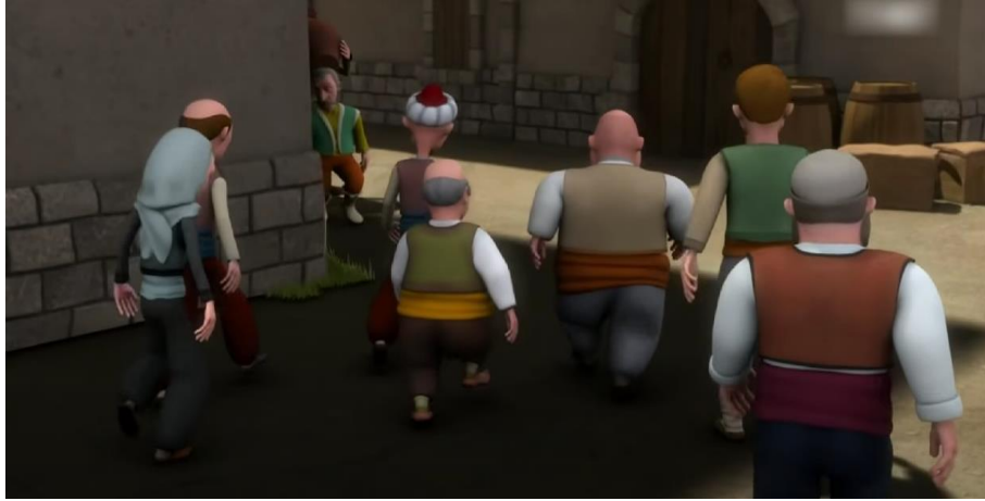
Şekil 2: Keloğlan Masalları 7. Bölüm Yılın Maçı

Pepee'nin Kalbim Kırıldı 2. bölümü 10 dakika 35 saniyedir. Bölümde Pepee'ye babası bir ittirgit alır ve kardeşi Bebe ittirgiti sürerken kırar ve bunun üzerine Pepee kardeşinin kıldığını anlayarak dedesine Bebe hakkında kıskandığı için kıldığını ve onu artık sevmediğini söyler. Bebe ise bu duruma çok üzülür ve ittirgiti tamir ederek kalbinin kırıldığını şarkı söyleyerek abisi ve ailesine söyler sonrasında ise Pepee, Bebe'den özür diler ve barışırlar. Kültürel öğelerin kullanımı noktasında ise Kapadokya bölgesinde kullanılan balonlardan bir tanesi görülmektedir, diğer Türk kültürüne ait öğelerse dede ve nenenin kıyafetleri olmuştur Şekil 1'de görüldüğü üzere, dedenin giysilerinin tasarımında Anadolu'da yaygın olarak kullanılan yelek tercih edilmiştir. Nene karakterinde ise yine aynı şekilde çiçekli bir bluz ve üzerine yelek ve başörtü bağlama şekli ile Türk kültürüne ait öğeler işlenmiştir.