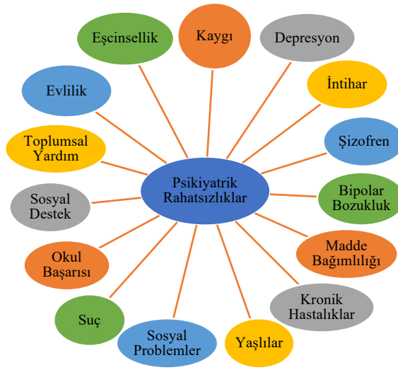
Şekil 1 Ele Alınan Psikiyatrik Rahatsızlıklar